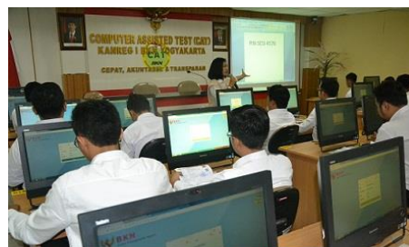
Para peserta tes SKD penerimaan CPNS BATAN di Yogyakarta diberikan penjelasan cara penggunaan aplikasi CAT, Rabu (31/10).