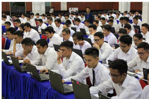
Peserta tes Seleksi Kompetensi Dasar penerimaan CPNS BATAN 2018 sedang mengerjakan soal melalui basis Computer Assisted Test (CAT)