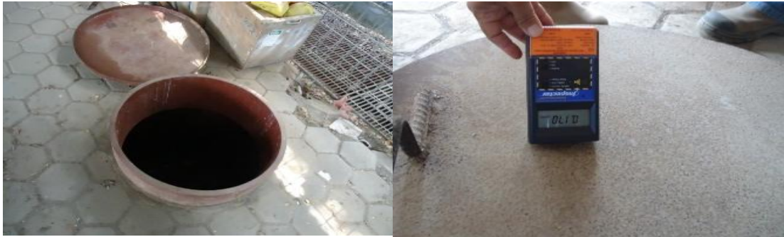
Gambar 4. Pengukuran paparan radiasi pada permukaan sumber Ir-192 (Boom-Pit)