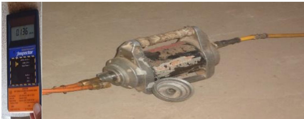
Gambar 3. Surveimeter Inspector dan Sumber Ir-192 Gamma Mat.

sumber yang digunakan pada saat pengukuran ditampilkan dalam Gambar 3. Hasil pengukuran paparan radiasi di Boom-pit pada Tempat Penyimpanan Sumber 2 (TPS2) yang berisi sumber, dan Tempat Penyimpanan Sumber 1 (TPS1), tanpa sumber seperti pada Tabel 1.