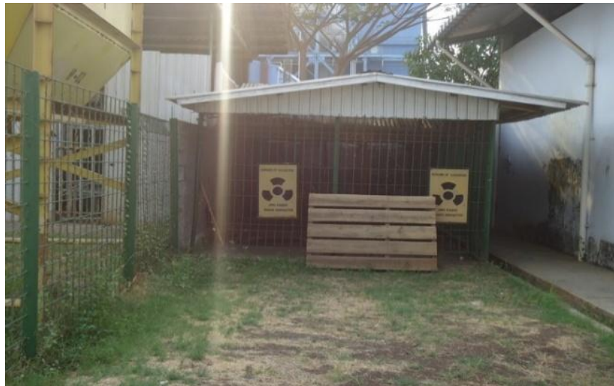
Gambar 1. Tempat Penyimpanan Sumber ( Boom-pit )

Pengukuran paparan radiasi di PT Gunanusa Utama Fabricators dilakukan pada daerah kerja tempat penyimpanan sumber ( Boom-Pit ) seperti pada Gambar. 1.