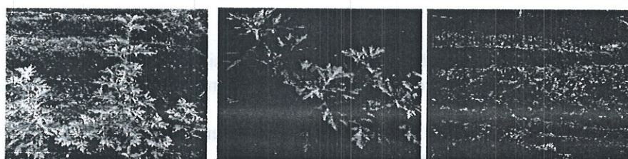
Gambar tanaman di lahan percobaan sebagai berikut :