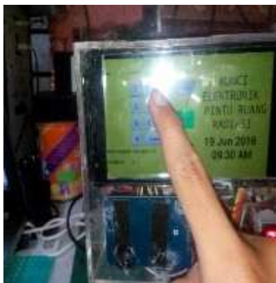
Gambar 6. Simulasi memasukkan pin ID