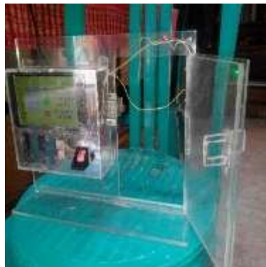
Gambar 4. Panel Simulasi Kunci Elektronik

Telah dibuat panel prototipe kunci pengaman elektronik pintu ruang radiasi berbahan akrilik. Panel tersebut berisikan rangkaian Arduino beserta perangkat Android sebagai sistem antarmuka kunci pengaman elektronik seperti terlihat pada Gambar 4, Gambar 5, dan Gambar 6.