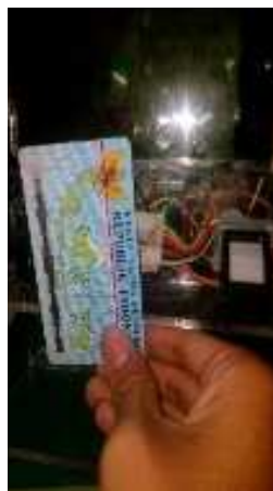
Gambar 5. Simulasi Deteksi RFID Card