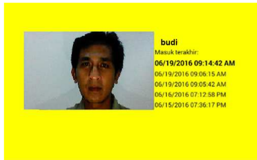
Gambar 2. Tampilan Data Gambar

Data gambar yang terlihat pada Gambar 2 berisikan tangkapan kamera depan perangkat Android ketika pengguna menekan tombol “buka” dan riwayat 5 waktu terakhir pengguna tersebut berhasil membuka pintu. Data gambar tersebut tersimpan dalam memori internal perangkat Android.