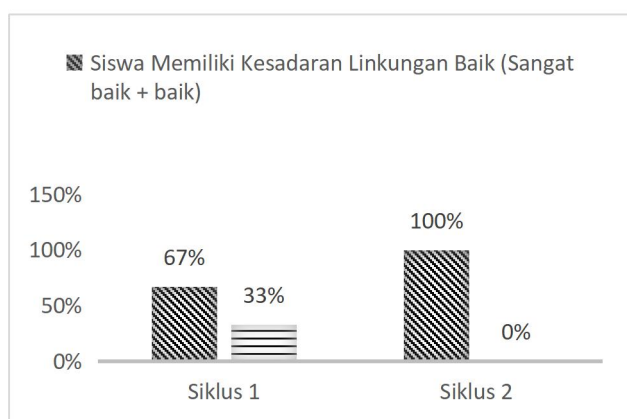
Gambar 2. Perbandingan Sikap Sadar Lingkungan Peserta Didik Kelas X 3 Pada Saat Siklus 1 dan Siklus 2

Sementara itu hasil angket sikap sadar lingkungan pada siklus 1 dan siklus 2 juga menunjukkan peningkatan yang signifikan. Berikut ini perbandingan hasil angket sikap sadar lingkungan peserta didik kelas X 3 pada siklus 1 dan siklus 2.