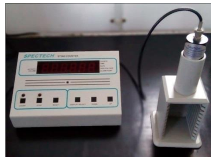
Gambar 4. Detektor Geiger Muller

Kemudian dibandingkan dengan pengujian terhadap radiasi gamma menggunakan detektor Geiger Muller yang ditunjukkan Gambar 4. dengan sumber standar Cs-137 dengan energi 662 KeV pada tegangan 900 V dalam waktu 60 detik dengan 30 kali pengulangan pada setiap sampel.