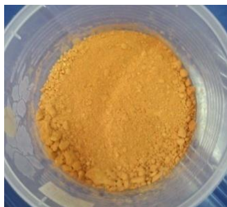
Gambar 1. Timbal (II) Oksida

Timbal oksida memiliki tampilan berwarna orange dengan bentuk berupa bubuk seperti yang ditunjukkan oleh Gambar 1. Keunggulan timbal oksida adalah harganya yang murah dibandingkan timbal dalam bentuk lain seperti PbCl 2 atau Pb 3 O 4 .