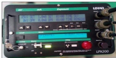
Gambar 2. Panel kontrol Lorad LPX200 STTN-BATAN

Pengujian dilakukan dengan mengukur perbandingan intensitas paparan radiasi yang datang dan yang diteruskan melalui sampel bahan apron menggunakan detektor dengan pembangkit radiasi sinar-X yang digunakan yaitu pesawat sinar-X lorad LPX200 STTN-BATAN dengan tegangan (kV) sinar-X 120 kV dan arus 5 mA selama 10 detik yang diatur melalui panel kontrol seperti yang ditunjukkan Gambar 2. dengan jarak bahan dari focal spot sebesar 90 cm seperti skema yang ditunjukkan oleh Gambar 3.