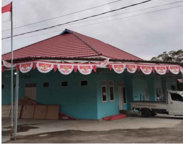
Gambar 2. Balai Desa Takuti