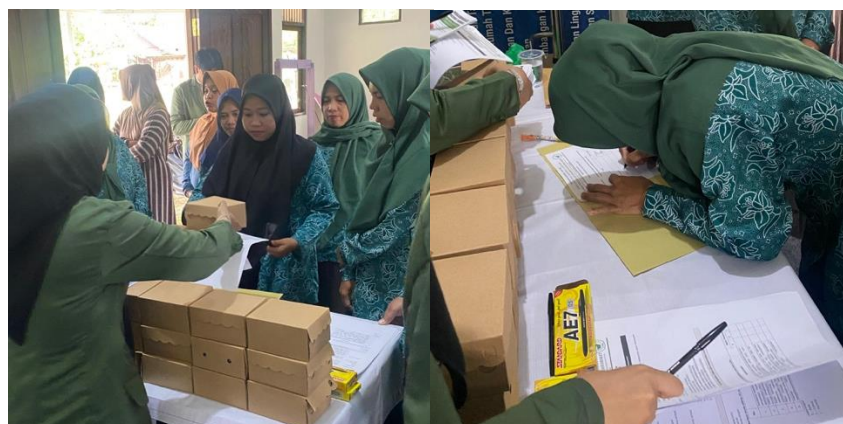
Gambar 3. Proses registrasi Peserta Kegiatan PKM

Kegiatan pengabdian ini diawali pada tanggal 13 Juni 2024 meliputi kegiatan survey dan kaderisasi ibu - ibu PKK Desa Takuti. Kegiatan PKM ini dilanjutkan pada tanggal 19 Juni 2024 meliputi kegiatan perakitan dan penyerahan alat destilator serta pendampingan pembuatan sediaan minyak atsiri sereh berupa sabun dan lilin aromaterapi. Kegiatan dimulai dengan registrasi peserta dan penyerahan kuesioner yang dapat dilihat pada Gambar 3.