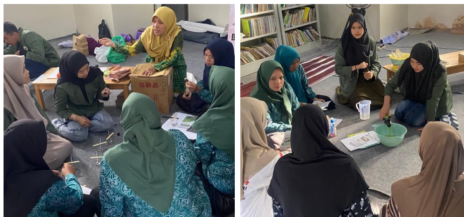
Gambar 5. Proses Pendampingan Kader PKK Desa Takuti Dalam Pembuatan Sabun dan Lilin Aromaterapi

Kegiatan berikutnya adalah pendampingan pembuatan sediaan sabun dan lilin aromaterapi. Pada kegiatan ini, peserta kegiatan dibagi menjadi 2 kelompok, yaitu kelompok pembuatan sabun dan lilin aromaterapi. Dalam proses pembuatan sediaan, setiap kelompok dibantu oleh tim PKM UNBL. Proses pendampingan pembuatan sediaan dapat dilihat pada gambar 5. Produk hasil pembuatan dapat dibawa oleh peserta kegiatan. Proses ini bertujuan agar peserta yang merupakan Kader TP PKK Desa Takuti dapat belajar cara pembuatan sediaan dari minyak atsiri sereh, sehingga dapat meningkatkan kreativitas dalam peningkatan UMKM Desa Takuti.