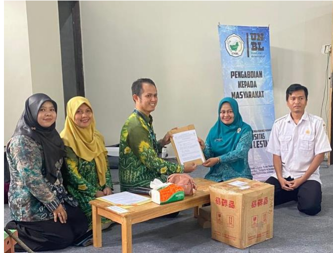
Gambar 4. Proses Penyerahan Alat Destilator

PkM yang dimulai dengan pembukaan dan dilanjutkan dengan sambutan oleh Ketua PKK Desa Takuti dan Ketua Pelaksana PkM. Proses penyerahan alat penyulingan dan demonstrasi perakitan alat dan pemakaiannya dapat dilihat pada Gambar 4.