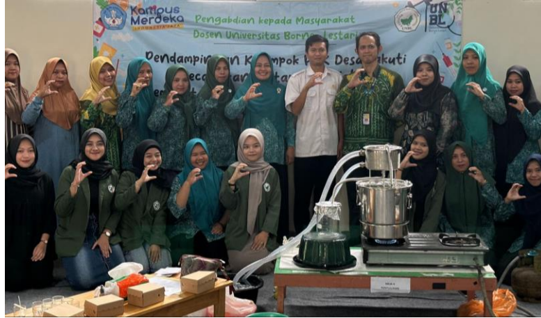
Gambar 6. Foto Bersama dengan Peserta Kegiatan PKM

Setelah proses pendampingan pembuatan sediaan selesai, kegiatan dilanjutkan dengan pengisian post-test dan foto bersama dengan Ketua beserta anggota PKK masyarakat Desa Takuti yang dapat dilihat pada Gambar 6.