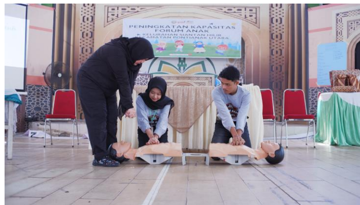
Gambar 3. Edukasi RJP dengan metode praktek pada manekin