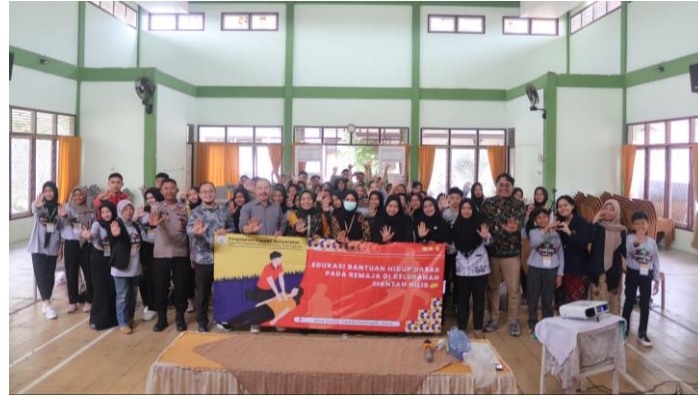
Gambar 2. Dokumentasi kegiatan PKM edukasi BHD di Aula Kantor Camat Pontianak Utara