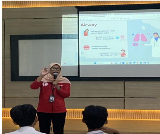
Gambar 2. Pemberian materi manajemen jalan napas