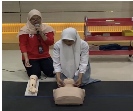
Gambar 3. Demonstrasi manajemen jalan napas dengan jaw thrust

Pada sesi demonstrasi, pemateri mempraktikkan beberapa teknik manajemen jalan napas seperti head-tilt, chin lift, jaw thrust, back blow, abdominal thrust / hemlich manuver. Siswa PMR mengikuti dengan mempraktikkan langsung bersama dengan fasilitator dari mahasiswa.