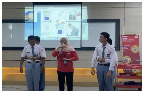
Gambar 4. Demonstrasi manajemen jalan napas pada kasus tersedak dengan teknik back blow dan abdominal thrust