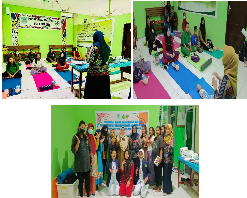
Gambar 2. Dokumentasi Kegiatan Pengabmas

mengurangi rasa sakit, mengurangi kembung dan kolik (sakit perut), meningkatkan volume ASI, meningkatkan berat badan, meningkatkan pertumbuhan, meningkatkan konsentrasi bayi dan membuat tidur lelap), serta memperbaiki sirkulasi darah dan pernapasan. Pijat bayi juga dapat membina ikatan kasih sayang orang tua dan anak (Siregar et al. , 2021).