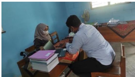
Gambar 2. Wawancara dengan guru

memadai dan perangkat teknologi yang lengkap. Sebagai contoh, seorang guru mengungkapkan, "Saya merasa kesulitan menggunakan aplikasi pembelajaran digital, meskipun sudah pernah mengikuti pelatihan. Saya masih membutuhkan bimbingan lebih lanjut."