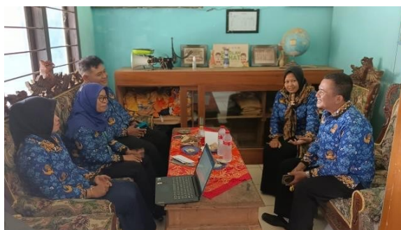
Gambar 3. Wawancara dengan guru (penulis, 2024)

Motivasi guru dalam mengikuti transformasi pendidikan juga dipengaruhi oleh dukungan yang mereka terima dari pihak sekolah dan pemerintah. Beberapa guru merasa kurang mendapatkan dukungan moral dan material yang memadai. Mereka merasa bahwa upaya mereka untuk meningkatkan kompetensi dan mengimplementasikan pembelajaran berbasis teknologi tidak mendapatkan apresiasi yang layak. Seorang guru mengungkapkan, "Kami merasa kurang didukung oleh pihak sekolah dan pemerintah. Tidak ada insentif atau penghargaan yang diberikan kepada guru yang berusaha keras untuk meningkatkan kompetensi."