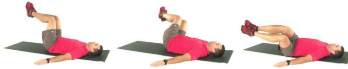
Gambar 3. Lower trunk rotation