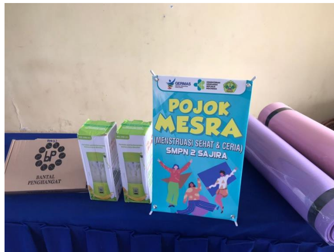
Gambar 7. Pojok MESRA (Menstruasi Sehat dan Ceria) SMPN 2 Sajira