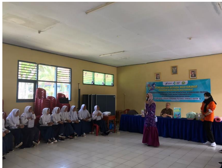
Gambar 5. Pelaksanaan Edukasi

Kegiatan VI : Evaluasi implementasi edukasi yang telah diberikan