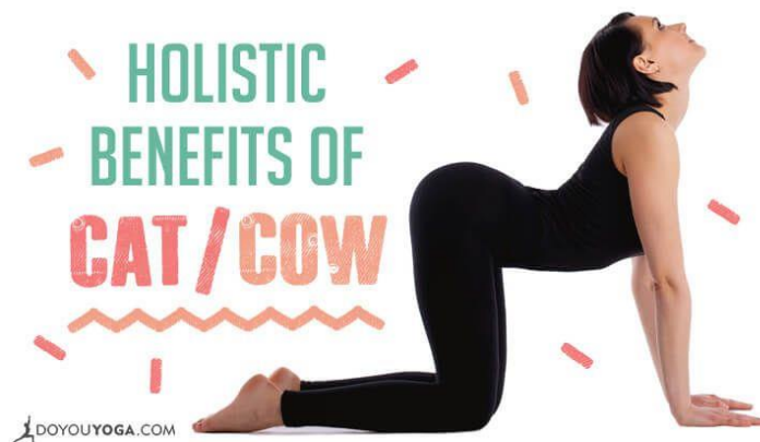
Gambar 2. Cat stretch

Senam peregangan ( stretching exercise ) dapat dilakukan untuk meningkatkan kekuatan otot, daya tahan dan fleksibilitas otot, dapat meningkatkan kebugaran, mengoptimalkan daya tangkap, meningkatkan mental dan relaksasi fisik, meningkatkan perkembangan kesadaran tubuh, mengurangi ketegangan otot (kram), mengurangi nyeri otot dan mengurangi rasa sakit pada saat menstruasi (Windastiwi et al, 2017)