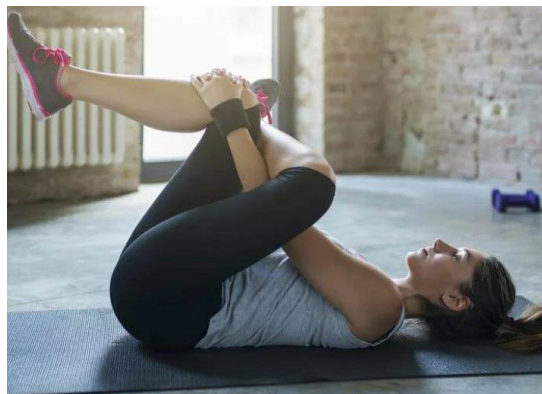
Gambar 4. Gerakan Buttock