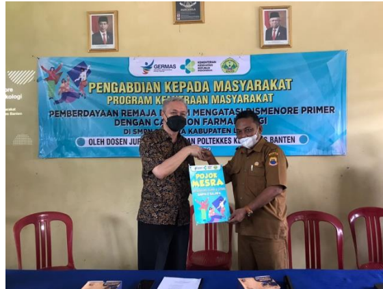
Gambar 6. Pencanangan Pojok MESRA (Menstruasi Sehat dan Ceria) SMPN 2 Sajira