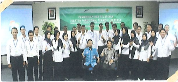
Foto bersama peserta diklat Jabatan Fungsional Teknisi Litkayasa Balitbang Pertanian dgn dengan Kepala Pusbindiklat BPPT di Ruang Kelas Lt.6 Pusbindiklat Gd.2 BPPT. Jakarta, 21 Februari 2017.

P usbindiklat melaksanakan diklat Jabatan Fungsional Teknisi Litkayasa batch satu Balitbang Pertanian untuk pelayanan public yang professional dan berkualitas. Bertempat di ruang diklat Pusbindiklat di Lt.6 Gedung BPPT II Jl. M.H. Thamrin No.8 Jakarta Pusat, tanggal 21 s.d 24 Februari 2017, Peserta Diklat JFTL Balibang Kementerian Pertanian sebanyak 30 orang.