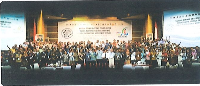
Foto bersama peserta seminar Sail Sabang & workshop Sato umi dgn Kepala BPPT. Bertempat di auditorium LT.3 Jakarta, 05 Oktober 2017

Pusbindiklat BPPT bekerjasama dengan Kementerian Koordinator Bidang Kemaritiman menyelenggarakan “National Seminar on Science Technology For Sabang Marine Tourism Development and The 4th International Workshop on Satoumi”.