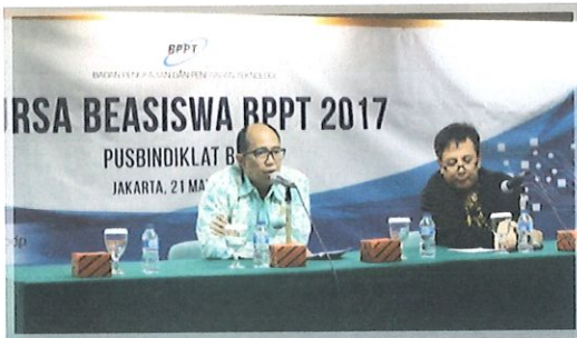
Pembukaan acara BPPT'S Scholarship Expo 2017' oleh SETAMA BPPT & Kepala Pusbindiklat Jakarta, 21 Februari 2017