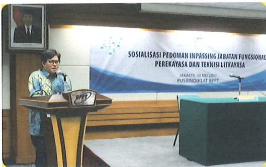
Sambutan Kepala BPPT dalam acara Sosialisasi Inpassing JFPTL, diruang Komisi Utama.

P usbindiklat BPPT melaksanakan acara Sosialisasi Pedoman Inpassing JFPTL Tahun 2017 bertempat di Ruang Komisi Utama Lt.3 Gd.2 BPPT. Jakarta, Selasa, 30 Mei 2017. Di hadiri 150 undangan peserta perwakilan dari Kementerian atau Lembaga serta Pemrov Daerah.