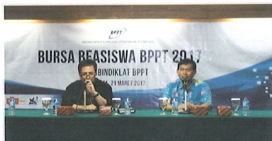
Penutupan acara BPPT'S Scholarship Expo 2017' oleh Kepala Pusbindiklat & Ka. Bidang PD Jakarta, 21 Februari 2017

Fasilitator/konsultan antara lain : Direktorat Kualifikasi SDM Iptek Kemenristekdikti, Atase kerjasama Sains dan Teknologi Kedutaan Perancis, Bagian Sains dan Teknologi Kedutaan AS, LPDP Kementerian Keuangan, AAS (Australia Awards Scholarships) Kedutaan Australia dan NESO (Netherlands Education Support Office Indonesia) Kedutaan Belanda.