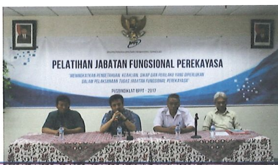
Pembukaan diklat JFP oleh Ka. Pusbindiklat di damping Ka. Bidang PD (kanan) & Ka. Sub Bidang Akreditasi serta Tim KPMI (kiri)

Untuk meningkatkan mutu diklat Jabatan Fungsional Perekayasa batch dua, bertempat di ruang diklat Pusbindiklat Lt.6 Gedung BPPT II Jl. M.H. Thamrin No.8 Jakarta Pusat, tanggal 16 s.d 19 Mei 2017, pukul 08.00-16.00. WIB. Diklat JFP di selenggarakan Pusbindiklat dan di ikuti 36 peserta terdiri dari : 34 orang BPPT, 1 orang Kemenperin dan 1 orang Pemprov Riau.