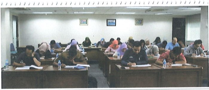
Peserta melaksanakan Tes TOEFL ITP bertempat di ruang rapat Kelas Lt.6 Pusbindiklat Gd.2 BPPT. Jakarta, 26 Juli 2017

Hasil tes atau skor masing-masing peserta tes telah dikirim melalui email sehari setelah penyelenggaraan tes. Peserta tes yang memiliki skor dalam rentang yang disyaratkan dalam pelatihan TOEFL ITP Preparation 2017, akan diikutsertakan dalam tahap seleksi berikutnya