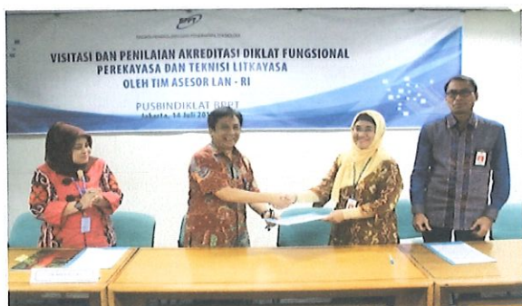
Penandatanganan hasil visitasi antara Kepala Pusbindiklat (kanan) & Ketua Tim Asesor Visitasi LAN. Bertempat di ruang Komisi I. Jakarta, 14 Juli 2017

Pusbindiklat BPPT melaksanakan kegiatan visitasi penilaian akreditasi diklat jabatan fungsional perekayasa dan teknisi litkayasa oleh tim asesor LAN RI. Jakarta, Jum'at, 14 Juli 2017 bertempat di Ruang Komisi I Gd.2 BPPT Lt.3. Dihadiri oleh 30 undangan perwakilan dari Pusbindiklat, Kementerian PUPR, dan BATAN.