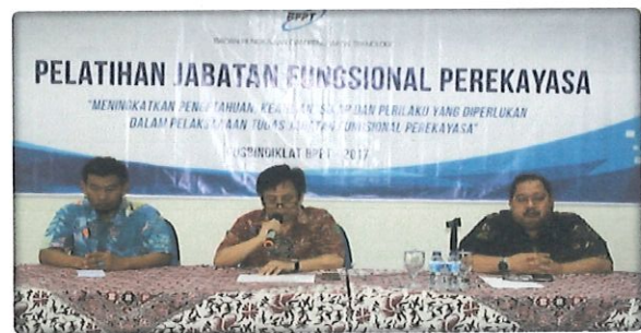
Pembukaan diklat JFP oleh Ka. Pusbindiklat di damping Ka. Bidang PD (kanan) & Ka. Bidang PED (kiri)

Evaluasi pelaksanaan diklat JFP dilakukan secara online (pre-test dan post test perekayasa, evaluasi penyelenggaraan, evaluasi pengajar dan penilaian pengajar terhadap penyelenggara) serta materi Diklat diberikan selama 32 Jam Pelajaran.