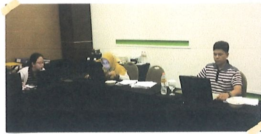
Suasana upload berkas dokumen Karyasiswa di ruang rapat Hotel Agria Bogor, 21 Februari 2017

karyasiswa Pusbindiklat berbentuk Web Database yang terdokumentasi dan terintegrasi dengan baik dan benar.