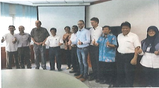
Foto bersama kepala Pusbindiklat dgn tim ELREN beserta undangan. Jakarta, 11 September 2017

P ertemuan antara Tim BPPT yang diwakili oleh Pusbindiklat, B2TKE, PTL, BTL, dan BTBRD dengan Tim ELREN. Bertempat di Ruang rapat Pusbindiklat Lt.6 BPPT, pada hari Senin, 11 September 2017 yang diikuti 12 undangan .