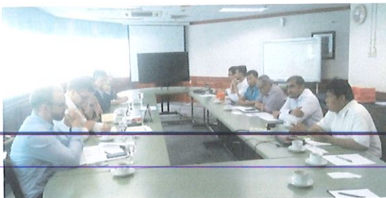
Diskusi dgn tim ELREN bertempat di Ruang rapat Pusbindiklat

Acara ini untuk membuka peluang penguatan sinergitas institusional dalam penguatan sumber daya manusia dalam pelaksanaan elektrifikasi perdesaan di Indonesia.