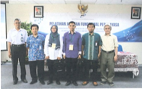
Foto bersama peserta diklat JFP batch.2 dgn Kepala Pusbindiklat BPPT & Tim KPMI di ruang Kelas Lt.6 Pusbindiklat Gd.2 BPPT. Jakarta, 16 Mei 2017

Untuk meningkatkan mutu diklat Jabatan Fungsional Perekayasa batch dua, bertempat di ruang diklat Pusbindiklat Lt.6 Gedung BPPT II Jl. M.H. Thamrin No.8 Jakarta Pusat, tanggal 16 s.d 19 Mei 2017, pukul 08.00-16.00. WIB. Diklat JFP di selenggarakan Pusbindiklat dan di ikuti 36 peserta terdiri dari : 34 orang BPPT, 1 orang Kemenperin dan 1 orang Pemprov Riau.