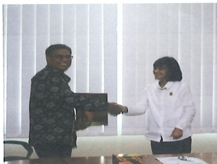
Penyerahan hasil penilaian akreditasi oleh Ka Pusdiklat LAN Ke Kepala Sub Bidang Akreditasi di ruang rapat LAN. Jakarta, 02 Agustus 2017

D alam rangka melaksanakan penilaian akreditasi untuk proses akreditasi Diklat Fungsional Perekayasa dan Teknisi Litkayasa pada Pusbindiklat BPPT. Pusbindiklat menghadiri undangan acara Sosialisasi Hasil Sidang Penilaian Akreditasi Lembaga Diklat Pemerintah yang dilaksanakan Lembaga Akreditasi Nasional (LAN) RI.