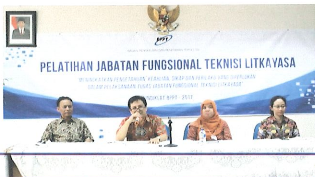
Pembukaan pelatihan JFTL oleh Ka. Pusbindiklat di dampingi Ka. Sub bidang TU (kanan) & Ka.bidang AP serta Ka. Sub bidang diklat teknis (kiri)

Diklat JFTL diikuti sebanyak 33 peserta antara lain : 24 orang Kementerian ESDM, 7 orang BPPT dan 2 orang Pemkot Bogor.