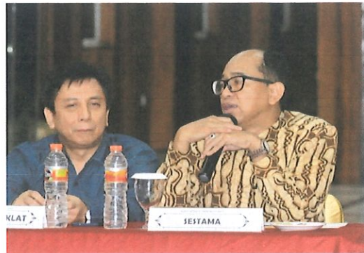
Sambutan SETAMA BPPT dalam acara raker Pusbindiklat di damping Ka. Pusbindiklat Bogor, 30 Maret 2017

R apat kerja Pusbindiklat dengan Tema “ Dalam rangka meningkatkan profesionalisme sumber daya manusia BPPT, perekayasa dan teknisi litkayasa nasional, kita tingkatkan pelayanan prima, mutu pembinaan, pendidikan dan pelatihan”. Bertempat The highland Park Resort, Hotel, di Bogor, hari Kamis – Jum’at pada tanggal 30 s.d 31 Maret 2017. Raker di ikuti 37 orang.