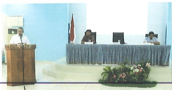
Sambutan Kepala Pusdiklatluh KKP dalam acara diklat JFP

Pusbindiklat BPPT bekerjasama dengan Balai Pendidikan dan Pelatihan Aparatur Kementerian Kelautan dan Perikanan melaksanakan Diklat Jabatan Fungsional Perekayasa Batch.1. Di Balai Diklat Aparatur Kementerian KKP Sukamandi Subang, Jawa Barat, tanggal 28 s.d 31 Agustus 2017. Diklat JFP diikuti sebanyak 34 peserta dari 15 unit kerja seluruh Indonesia di KKP.