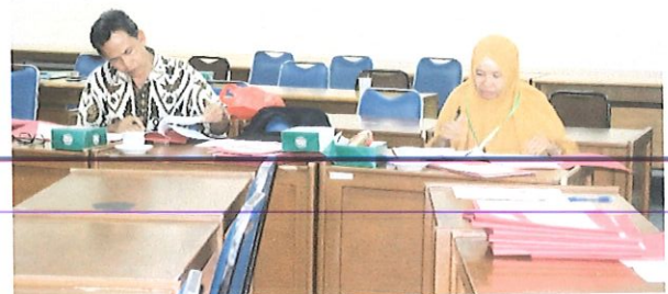
Suasana penilaian berkas inpassing JFTL yg dilakukan oleh tim penilaian JFTL bertempat di ruang kelas Pusbindiklat Lt.6