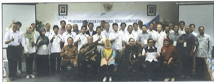
Foto bersama peserta diklat Jabatan Fungsional Teknisi Litkayasa batch.5 dgn Kepala Pusbindiklat BPPT di Ruang Kelas Lt.6 Pusbindiklat Gd.2 BPPT, Jakarta, 26 September 2017.

P usbindiklat BPPT dan Komite Penjamin Mutu Independent (KPMI) melaksanakan monitoring dan evaluasi Diklat Jabatan Fungsional Teknisi Litkayasa Batch.5. di ruang Pusbindiklat di Lt.6 Gedung BPPT II Jl. M.H. Thamrin No.8. Jakarta Pusat, tanggal 26 s.d 29 September 2017. Diklat JFTL diikuti sebanyak 32 peserta dari Kementerian ESDM.