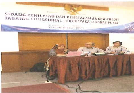
Suasana sidang pleno yang dipimpin Oleh Ka.Bidang AP (kanan), Ketua tim penilai serta wakil tim penilai (kiri)

P usbindiklat BPPT melaksanakan Penilaian dan Sidang Penetapan Angka Kredit Jabatan Fungsional Perekayasa Tingkat Pusat bertempat di Hotel Salak Bogor, Jakarta, 11 s.d 14 Juli 2017 yang dihadiri oleh 20 peserta yang terdiri dari tim penilai pusat dan personil Pusbindiklat.