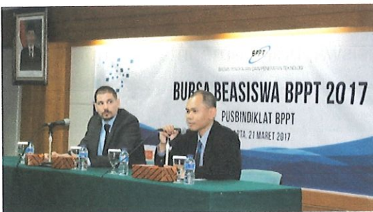
Paparan program studi S2/S3 di Perancis dari atase kerjasama Sains dan Teknologi Kedutaan Perancis. Jakarta, 21 Februari 2017

U paya Strategis Menjalin Kemitraan Dalam Pengembangan SDM BPPT.