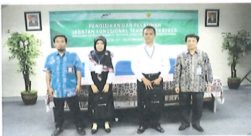
Foto bersama Ka.Pusbindiklat didampingi Ka. Bidang PD & 2 orang perwakilan Peserta.

P usbindiklat melaksanakan diklat Jabatan Fungsional Teknisi Litkayasa batch satu Balitbang Pertanian untuk pelayanan public yang professional dan berkualitas. Bertempat di ruang diklat Pusbindiklat di Lt.6 Gedung BPPT II Jl. M.H. Thamrin No.8 Jakarta Pusat, tanggal 21 s.d 24 Februari 2017, Peserta Diklat JFTL Balibang Kementerian Pertanian sebanyak 30 orang.