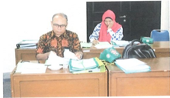
Suasana penilaian berkas inpassing JFP yg dilakukan oleh tim penilaian JFP bertempat di ruang kelas Pusbindiklat Lt.6

Implementasi Peraturan Kepala BPPT No.10 dan no.11 Tahun 2017 tentang Pengangkatan PNS dalam JF Perekayasa dan Teknisi Litkayasa (JFPTL) melalui penyesuaian/inpassing. maka Pusbindiklat BPPT telah melaksanakan penilaian berkas inpassing Jabatan Fungsional Perekayasa dan Teknisi Litkayasa batch.2 pada hari Jum'at, 15 Desember 2017, bertempat di Ruang Kelas Pusbindiklat di Lt.6 Gedung BPPT II Jl. M.H. Thamrin No.8. Jakarta Pusat.