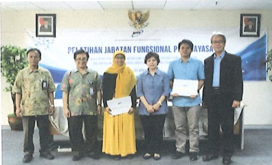
Foto bersama perwakilan alumni diklat JFP batch.3 dgn Kepala Pusbindiklat BPPT & Widyaswara di ruang Kelas Lt.6 Pusbindiklat Gd.2 BPPT. Jakarta, 16 Mei 2017

P usbindiklat melaksanakan diklat Jabatan Fungsional Perekayasa batch tiga, bertempat di ruang diklat Pusbindiklat Lt.6 Gedung BPPT II Jl. M.H. Thamrin No.8 Jakarta Pusat, tanggal 18 s.d 21 Juli 2017, pukul 08.00-16.00. WIB. Diklat JFP B3 di selenggarakan Pusbindiklat selama 4 hari dan dalam evaluasi diklat menerapkan secara online untuk meningkatkan mutu penyelenggaraan diklat dan di ikuti 35 peserta terdiri dari : 31 orang BPPT, 2 orang Kementerian ESDM dan 2 orang Pemkot Bogor.