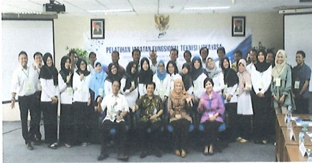
Foto bersama peserta diklat Jabatan Fungsional Teknisi Litkayasa batch.4 dgn Kepala Pusbindiklat BPPT di Ruang Kelas Lt.6 Pusbindiklat Gd.2 BPPT. Jakarta, 11 Juli 2017.

P usbindiklat BPPT melaksanakan Diklat Jabatan Fungsional Teknisi Litkayasa Batch.4. di ruang Pusbindiklat di Lt.6 Gedung BPPT II Jl. M.H. Thamrin No.8. Jakarta Pusat, tanggal 11 s.d 14 Juli 2017.