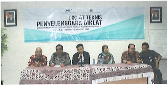
Penutupan kegiatan TOC oleh Ka. Pusbindiklat (tengah), Widyaswara Diklat TF,LAN (kanan) didampingi Ka.Bidang PD, Ka.Bidang PED, & Ka.Bidang AP (kiri)