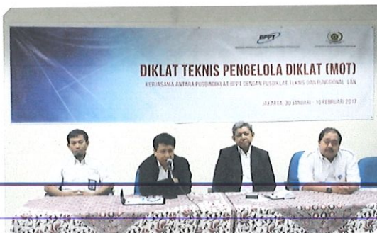
Pembukaan kegiatan MOT oleh Ka. Pusbindiklat, Kapus Diklat TF,LAN (tengah) didampingi Ka.Bidang PD (kanan) & Ka.Bidang PED (kiri)

Salah satu syarat mutlak yang harus dipenuhi agar sebuah lembaga diklat dapat menyelenggarakan kegiatan diklat, baik DiklatPIM dan Diklat Prajabatan, Diklat Teknis serta Diklat Fungsional adalah Akreditasi Lembaga Diklat.