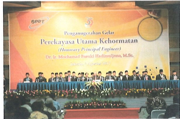
Sidang Majelis Perekayasa Utama bertempat di auditorium BPPT

P usbindiklat BPPT menyelenggarakan Gelar Perekayasa Utama Kehormatan (PUK) yang ke-11 Tahun 2017 yang diberikan kepada Bapak Basuki Hadimuljono (Menteri Pekerjaan Umum dan Perumahan Rakyat). Jakarta, Kamis, 03 Agustus 2017, bertempat di Auditorium BPPT Lt.3.