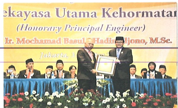
Penyerahan sertifikat PUK oleh Kepala BPPT ke Bapak Basuki Hadimuljono

Wapres Jusuf Kalla dalam sambutannya "Keberhasilan rekayasa teknologi akan menjadikan bangsa kita dapat lebih bersaing. Itulah prinsip dasar hari ini,".