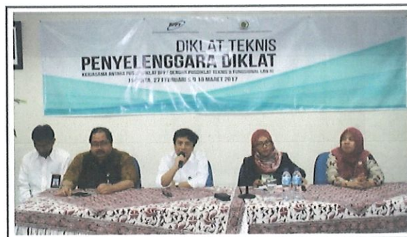
Pembukaan kegiatan TOC oleh Ka. Pusbindiklat, Widyaswara Diklat TF, LAN (tengah) didampingi Ka. Bidang PD, Ka. Bidang PED (kanan) & Ka. Bidang AP (kiri)

diklat yang berkualitas sehingga tujuan dan sasaran dapat tercapai.