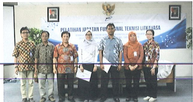
Foto bersama perwakilan alumni diklat FTL dgn Kepala Pusbindiklat BPPT di Ruang Kelas Lt.6 Pusbindiklat Gd.2 BPPT

Penyelenggaraan Diklat selama 4 (empat) hari di mulai pukul 08.00 s.d 16.00. WIB, sebelum diklat dimulai dilaksanakan evaluasi pre test & setelah diklat dilakukan evaluasi post test dilakukan secara manual serta evaluasi penyelenggaraan & pengajar secara online.