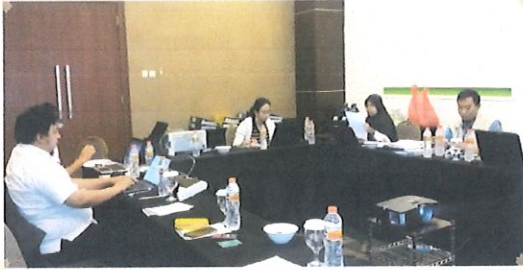
Suasana entri data berkas dokumen Karyasiswa di ruang rapat Hotel Agria Bogor, 20 Februari 2017

D alam rangka pengembangan basis data karyasiswa BPPT, maka telah dilaksanakan konsenyering karyasiswa pada Tanggal 20 s.d 22 Februari 2017 bertempat di Hotel Agria Bogor.