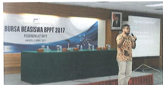
Paparan program studi S2/S3 di Amerika Serikat dari Bagian Sains dan Teknologi Kedutaan AS