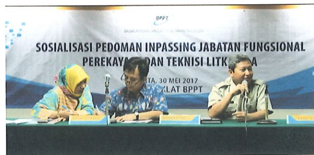
Kepala Pusbindiklat (tengah) & Ka. Bidang AP (kanan) serta Direktur Pengadaan dan Kepangkatan - BKN (kiri)