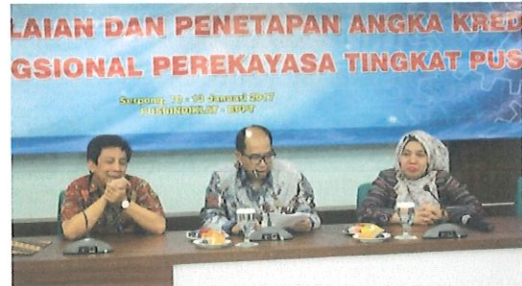
Sambutan SETAMA BPPT dalam acara penilaian JFP tingkat pusat (tengah) didampingi Kepala Pusbindiklat (kanan) dan Ka. Bidang AP (kiri).

D alam rangka meningkatkan pengembangan karir Jabatan Fungsional Perekayasa, maka telah diselenggarakan kegiatan Penilaian Jabatan Fungsional Perekayasa Tingkat Pusat pada tanggal 10 s.d 13 Januari 2017, bertempat di Wisma Tamu Puspipstek, Serpong.