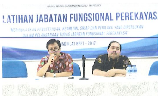
Pembukaan pelatihan JFP oleh Ka. Pusbindiklat (kanan) & Kepala Bidang PED (kiri)

P usbindiklat melaksanakan diklat Jabatan Fungsional Perekayasa batch tiga, bertempat di ruang diklat Pusbindiklat Lt.6 Gedung BPPT II Jl. M.H. Thamrin No.8 Jakarta Pusat, tanggal 18 s.d 21 Juli 2017, pukul 08.00-16.00. WIB. Diklat JFP B3 di selenggarakan Pusbindiklat selama 4 hari dan dalam evaluasi diklat menerapkan secara online untuk meningkatkan mutu penyelenggaraan diklat dan di ikuti 35 peserta terdiri dari : 31 orang BPPT, 2 orang Kementerian ESDM dan 2 orang Pemkot Bogor.