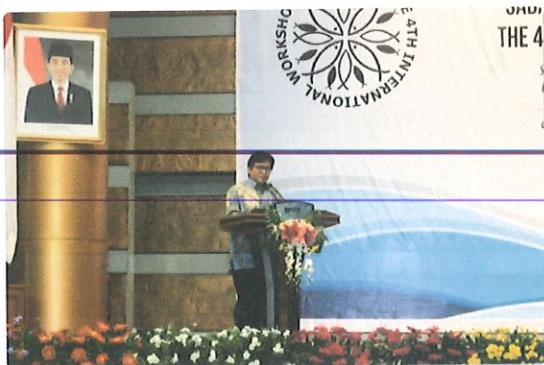
Sambutan Kepala BPPT pada acara seminar Sail Sabang & workshop Sato umi di auditorium BPPT

Dilaksanakan selama 2 hari pada tanggal 5 s.d 6 Oktober 2017 bertempat di Auditorium dan Komisi Utama BPPT Lt.3, Jl. M.H.Thamrin No.08 Jakarta. Diikuti 300 peserta perwakilan dari Kementerian atau Lembaga (K/L), Pemerintah Provinsi, EMECS, HIMPENINDO, HIMPENINDO serta Universitas.