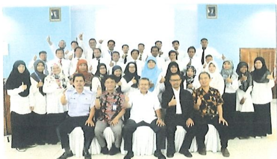
Foto bersama peserta diklat JFP batch.1 dgn Kepala Pusdiklatluh KKP & Widyaswara di balai diklat Sukamandi Jakarta, 28 Agustus 2017

Pusbindiklat BPPT bekerjasama dengan Balai Pendidikan dan Pelatihan Aparatur Kementerian Kelautan dan Perikanan melaksanakan Diklat Jabatan Fungsional Perekayasa Batch.1. Di Balai Diklat Aparatur Kementerian KKP Sukamandi Subang, Jawa Barat, tanggal 28 s.d 31 Agustus 2017. Diklat JFP diikuti sebanyak 34 peserta dari 15 unit kerja seluruh Indonesia di KKP.