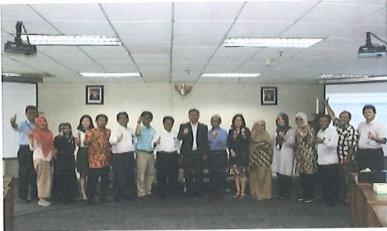
Foto bersama STEPI IICC dengan Kepala Pusbindiklat BPPT di Ruang Kelas Lt.6 Pusbindiklat Gd.2 BPPT. Jakarta, 18 Desember 2017

D alam rangka meningkatkan kerjasama antara BPPT dan STEPI, Pusbindiklat memfasilitator kegiatan “ Visit STEPI'S To BPPT”. Pada hari senin, 18 Desember 2017, bertempat di ruang kelas Pusbindiklat Lt.6 Gd.2 BPPT. Peserta 20 orang perwakilan dari Bidang Kedeputihan Pengkajian Kebijakan Teknologi (PKT), STEPI IICC dan Pusbindiklat.