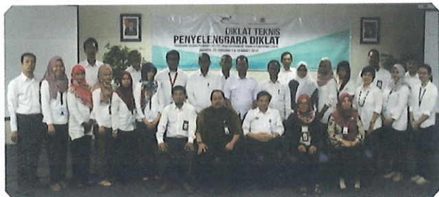
Foto bersama Ka. Pusbindiklat & Widyaswara Diklat TF, LAN (tengah) didampingi Ka.Bidang PD (kanan), Ka.Bidang PED (kanan), Ka.Bidang AP (kiri) serta peserta TOC Pusbindiklat BPPT. Jakarta, 27 Februari 2017

P enyelenggara Diklat TOC adalah sebuah diklat yang dapat mempersiapkan penyelenggara diklat memfasilitasi terlaksananya berbagai diklat yang berkualitas. Penyelenggaraan TOC dirasakan sangat penting untuk diselenggarakan agar semua pelaksana diklat dapat mencapai tujuan pengembangan sumberdaya aparatur yang di amanatkan dalam kerangka reformasi birokrasi dan tata kelola pemerintahan yang baik. Selain itu TOC ini juga merupakan bagian persyaratan dari akreditasi program diklat.