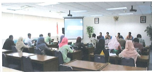
Pembukaan dan pengarahan karyasiswa beasiswa BPPT oleh Ka. Pusbindiklat kepada peserta Jakarta, 28 Juli 2017

B idang Penyelenggaraan Diklat melaksanakan acara pengarahan Kepala Pusbindiklat dan penandatanganan perjanjian tugas belajar karyasiswa beasiswa BPPT Tahun 2017, bertempat di Ruang Kelas Pusbindiklat Lt.6 BPPT, pada hari Jum'at, 28 Juli 2017. Peserta tugas belajar diikuti 20 peserta perwakilan dari unit kerja di BPPT.