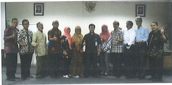
Foto bersama tim penilai inpassing JFPTL batch.2 dengan Kepala Pusbindiklat BPPT di Ruang Kelas Lt.6 Pusbindiklat Gd.2 BPPT. Jakarta, 15 Desember 2017