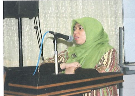
Sambutan Kepala Bidang AP Pusbindiklat dalam Acara sosialisasi bertempat di ruang Komisi II

Sosialisasi ini bertujuan untuk memberikan informasi penggunaan aplikasi sistim inpassing Jabatan Fungsional Perekayasa dan Teknisi Litkayasa berbasis Website kepada peserta sekaligus uji coba aplikasi.