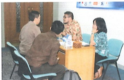
Konsultasi peserta program studi S2/S3 di Booth Bagian Sains dan Teknologi Kedutaan AS

Peserta bursa beasiswa BPPT dari perwakilan 44 unit kerja BPPT, sekitar 100 orang.