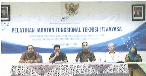
Pembukaan pelatihan JFTL oleh Ka. Pusbindiklat didampingi Ka. Bidang PED (kanan) serta Perwakilan Balitbang Kementan & Ka. Bidang AP (kiri)

P usbindiklat BPPT melaksanakan Diklat Jabatan Fungsional Teknisi Litkayasa Batch.6. di ruang Pusbindiklat di Lt.6 Gedung BPPT II Jl. M.H. Thamrin No.8. Jakarta Pusat, tanggal 05 s.d 18 Desember 2017. Diklat JFTL diikuti sebanyak 30 peserta dari Kementerian Pertanian.