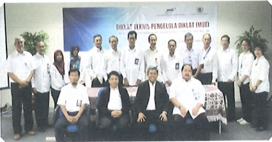
Foto bersama Ka. Pusbindiklat & Kapus Diklat TF,LAN (tengah) didampingi Ka.Bidang PD (kanan), Ka.Bidang PED (kiri) serta peserta MOT Pusbindiklat. Jakarta, 30 Januari 2017

R eformasi Birokrasi memerlukan birokrat-birokrat yang berpikir inovatif, berani melakukan perubahan dan terobosan positif sehingga visi dan misi organisasi dapat tercapai.