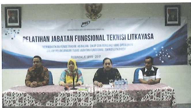
Pembukaan pelatihan JFTL oleh Ka. Bidang AP di damping tim ESDM (kanan) & Ka. Bidang PED (kiri)

P usbindiklat BPPT dan Komite Penjamin Mutu Independent (KPMI) melaksanakan monitoring dan evaluasi Diklat Jabatan Fungsional Teknisi Litkayasa Batch.5. di ruang Pusbindiklat di Lt.6 Gedung BPPT II Jl. M.H. Thamrin No.8. Jakarta Pusat, tanggal 26 s.d 29 September 2017. Diklat JFTL diikuti sebanyak 32 peserta dari Kementerian ESDM.