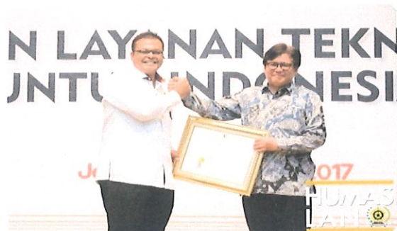
Penyerahan sertifikat penyerahan diklat JFPTL oleh Kepala LAN Ke Kepala BPPT. Jakarta, 02 Agustus 2017

P usbindiklat BPPT telah mendapatkan Akreditasi Penyelenggaraan Diklat Fungsional Perekayasa dan Teknisi Litkayasa (JFPTL) yang ditetapkan berdasarkan hasil Sidang Penilaian Akreditasi oleh Lembaga Administrasi Negara (LAN) RI dan mendapatkan hasil Penilaian KATEGORI A (SANGAT BAIK) dengan Nilai 94,97. Jakarta, 02 Agustus 2017, bertempat diauditorium BPPT LT.3 Gd.II BPPT.