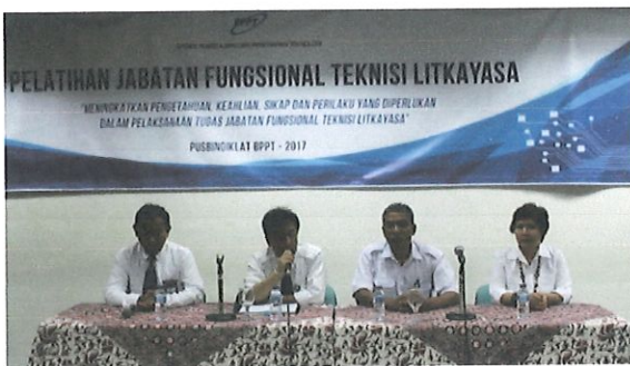
Pembukaan pelatihan JFTL oleh Ka. Pusbindiklat di dampingi Ka. Bidang PD (kanan) & Ka.Sub bidang Akreditasi serta Ka. Sub bidang Evaluasi (kiri)

Pusbindiklat BPPT untuk pertama kalinya melaksanakan evaluasi diklat secara online pada Diklat Jabatan Fungsional Teknisi Litkayasa Batch.3. di ruang Pusbindiklat di Lt.6 Gedung BPPT II Jl. M.H. Thamrin No.8. Jakarta Pusat, tanggal 15 s.d 18 Mei 2017. Diklat JFTL diikuti sebanyak 34 peserta antara lain : 29 orang BPPT dan 5 orang Kemenperin.