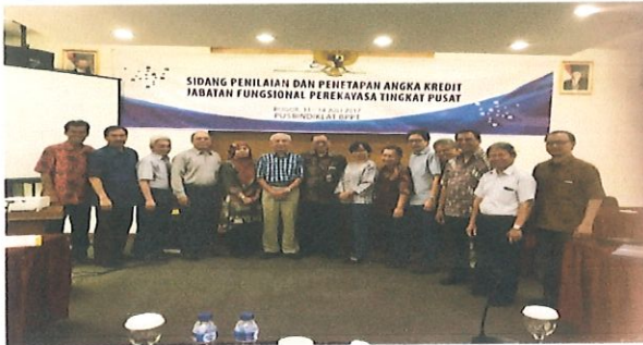
Foto bersama tim penilai pusat JFP dgn Kepala Pusbindiklat BPPT di ruang rapat Hotel Salak Bogor, Jakarta, 11 Juli 2017.

P usbindiklat BPPT melaksanakan Penilaian dan Sidang Penetapan Angka Kredit Jabatan Fungsional Perekayasa Tingkat Pusat bertempat di Hotel Salak Bogor, Jakarta, 11 s.d 14 Juli 2017 yang dihadiri oleh 20 peserta yang terdiri dari tim penilai pusat dan personil Pusbindiklat.