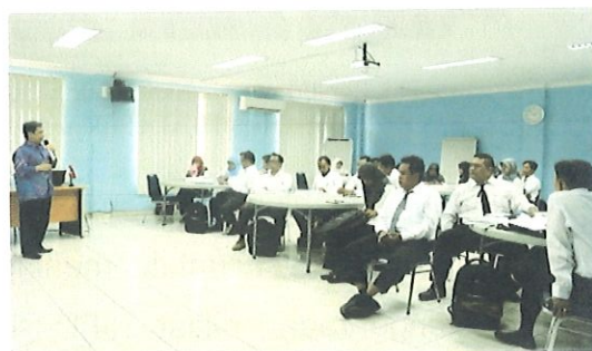
Pengarahan program dari Ka. Pusbindiklat BPPT Kepada peserta diklat di balai diklat Sukamandi

Perikanan (KKP) didampingi oleh Kepala Sub.Bid. Tata Usaha KKP dan Ka.Sub.Bid.Diklat Penjenjangan BPPT.