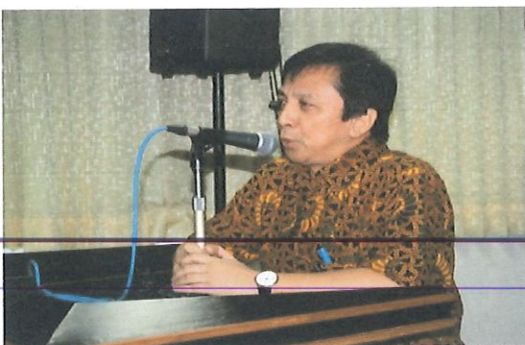
Sambutan Kepala Pusbindiklat dalam Acara sosialisasi bertempat di ruang Komisi II

Di hadiri 61 undangan peserta perwakilan dari Kementerian atau Lembaga serta Pemrov Daerah.