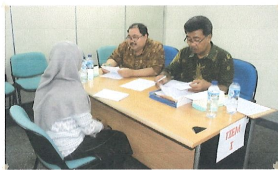
Wawancara dgn calon penerima beasiswa S2 oleh Ka.Bidang PED (kanan) & didampingi Tim Seleksi (kiri)

Adapun Tim Reviewer terdiri dari perwakilan unit kerja : SETAMA 10 org, PKT 2 org, TAB 1 org, TIEM 2 org, TPSA 2 org dan TIRBR 3 org.