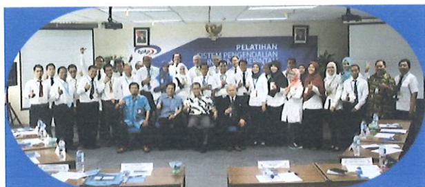
Foto bersama peserta diklat SPIP dgn Kepala Pusbindiklat & Kepala Pusdiklatwas BPKP di ruang Kelas Lt.6 Pusbindiklat Gd.2 BPPT. Jakarta, 02 Mei 2017

P usbindiklat BPPT melaksanakan Pelatihan Sistem Pengendalian Intern Pemerintah (SPIP) bertempat di ruang diklat Pusbindiklat Lt.6 Gedung BPPT II Jl. M.H. Thamrin No.8 Jakarta Pusat, tanggal 2 s.d 8 Mei 2017. Di ikuti 30 orang perwakilan Satker BPPT.