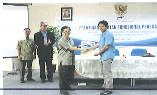
Kepala Pusbindiklat menyerahkan sertifikat diklat perekayasa kepada perwakilan peserta