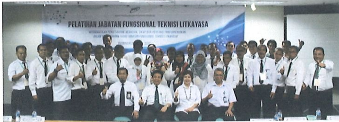
Foto bersama peserta diklat Jabatan Fungsional Teknisi Litkayasa batch.3 dgn Kepala Pusbindiklat BPPT di Ruang Kelas Lt.6 Pusbindiklat Gd.2 BPPT. Jakarta, 15 Mei 2017.

Pusbindiklat BPPT untuk pertama kalinya melaksanakan evaluasi diklat secara online pada Diklat Jabatan Fungsional Teknisi Litkayasa Batch.3. di ruang Pusbindiklat di Lt.6 Gedung BPPT II Jl. M.H. Thamrin No.8. Jakarta Pusat, tanggal 15 s.d 18 Mei 2017. Diklat JFTL diikuti sebanyak 34 peserta antara lain : 29 orang BPPT dan 5 orang Kemenperin.