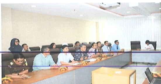
Peserta dari Pusbindiklat BPPT menghadiri sidang penilaian akreditasi di ruang rapat LAN.

Pada hari Rabu, 02 Agustus 2017, bertempat di Ruang Rapat Administrator G Gedung B Lt.6 LAN Jl. Veteran No.10 Jakarta Pusat, dihadiri 7 (tujuh) Lembaga Diklat.