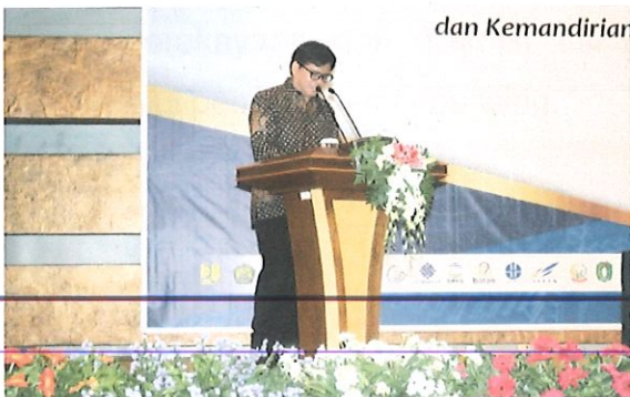
Sambutan Kepala BPPT pada acara Kongres Perekayasa Nasional di auditorium BPPT

P usbindiklat BPPT menyelenggarakan Kongres Perekayasa Nasional “Peran Perekayasa dalam meningkatkan Daya Saing dan Kemandirian Bangsa Melalui Pengembangan Teknologi. Dilaksanakan pada hari rabu,18 Oktober 2017 bertempat di Auditorium BPPT Lt.3, Jl. M.H.Thamrin No.08 Jakarta. Diikuti 250 peserta Fungsional Perekayasa perwakilan dari Kementerian atau Lembaga (K/L) dan HIMPENINDO.