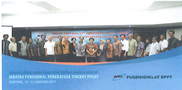
Foto bersama SETAMA BPPT dengan tim Penilaian Jabatan Fungsional Perekayasa, Serpong, 10-13 Januari 2017