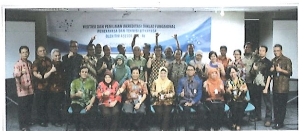
Foto bersama tim asesor LAN dgn Kepala Pusbindiklat BPPT di ruang komis I. Jakarta, 14 Juli 2017.

Pusbindiklat BPPT melaksanakan kegiatan visitasi penilaian akreditasi diklat jabatan fungsional perekayasa dan teknisi litkayasa oleh tim asesor LAN RI. Jakarta, Jum'at, 14 Juli 2017 bertempat di Ruang Komisi I Gd.2 BPPT Lt.3. Dihadiri oleh 30 undangan perwakilan dari Pusbindiklat, Kementerian PUPR, dan BATAN.