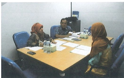
Wawancara dgn calon penerima beasiswa S2 oleh Ka.Bidang AP (kanan) & didampingi Tim Seleksi (kiri)

D alam rangka pelaksanaan seleksi pegawai calon penerima beasiswa S2 BPPT Tahun 2017 serta untuk meningkatkan SDM Pegawai BPPT. Telah dilaksanakan wawancara seleksi Beasiswa BPPT. Pada hari Selasa, 17 Januari 2017 dan bertempat diruang diklat Pusbindiklat Lt.6,Gd.II BPPT.