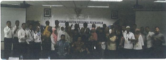
Foto bersama peserta diklat JFP batch.1 dgn Kepala Pusbindiklat BPPT di ruang Kelas Lt.6 Pusbindiklat Gd.2 BPPT. Jakarta, 25 April 2017

Untuk mengembangkan kompetensi dan karir Aparatur Sipil Negara (ASN) melalui diklat Jabatan Fungsional Perekayasa batch satu, tempat di ruang diklat Pusbindiklat Lt.6 Gedung BPPT II Jl. M.H. Thamrin No.8 Jakarta Pusat, tanggal 25 s.d 28 April 2017, pukul 08.00-16.00. WIB. Diklat JFP di selenggarakan Pusbindiklat dan di ikuti 36 peserta.