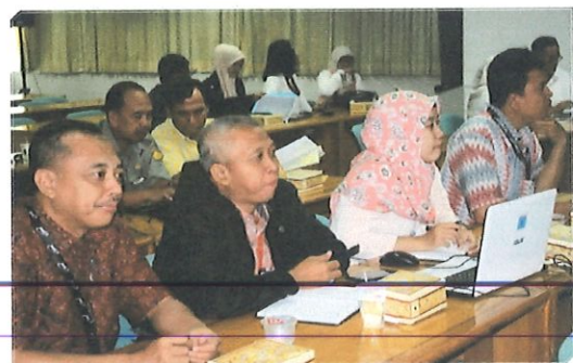
Peserta acara sosialisasi dalam pelaksanaan uji coba Sistem Inpassing JFPTL