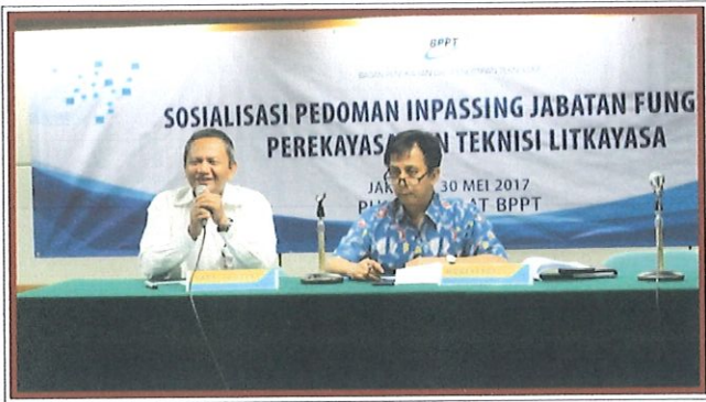
Pengarahan oleh Asisten Deputi Standarisasi Jabatan dan Pengembangan SDM Aparatur Kemempnan RB (kanan) & Kepala Pusbindiklat BPPT Jakarta, 30 Mei 2017

P usbindiklat BPPT melaksanakan acara Sosialisasi Pedoman Inpassing JFPTL Tahun 2017 bertempat di Ruang Komisi Utama Lt.3 Gd.2 BPPT. Jakarta, Selasa, 30 Mei 2017. Di hadiri 150 undangan peserta perwakilan dari Kementerian atau Lembaga serta Pemrov Daerah.