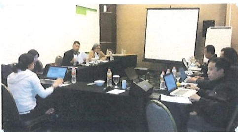
Suasana upload berkas dokumen Karyasiswa di ruang rapat Hotel Agria Bogor, 21 Februari 2017

Tujuan konsenyering adalah membuat base line data karyasiswa BPPT sehingga mendukung pengembangan layanan diklat teknis bergelar secara elektronik.