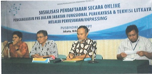
Pengantar sosialisasi oleh Ka.Subbidang Data didampingi oleh Ka.subbidang akreditasi (kanan) & tim secretariat dan IT (kiri). Jakarta, 10 Agustus 2017

P usbindiklat BPPT melaksanakan acara Sosialisasi Pendaftaran secara online pengangkatan PNS dalam Jabatan Fungsional Perekayasa dan Teknisi Litkayasa melalui penyesuaian/inpassing Tahun 2017 bertempat di Ruang Komisi I dan II Lt.3 Gd.2 BPPT. Jakarta, Kamis, 10 Agustus 2017.