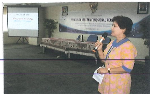
Ka.Subbid Evaluasi memberikan arahan kepada peserta dalam rangka pelaksanaan evaluasi diklat secara online

Evaluasi pelaksanaan diklat JFP dilakukan secara online (pre-test dan post test perekayasa, evaluasi penyelenggaraan, evaluasi pengajar dan penilaian pengajar terhadap penyelenggara) serta materi Diklat diberikan selama 32 Jam Pelajaran.