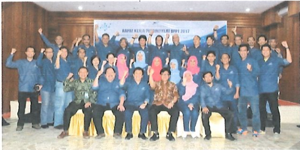
Foto bersama Ka.BPPT, di damping Ka.Pusbindiklat, Perwakilan Pusyantek, para Ka. Bidang Pusbindiklat (duduk) serta peserta Pusbindiklat (berdiri). Bogor, 31 Maret 2017.