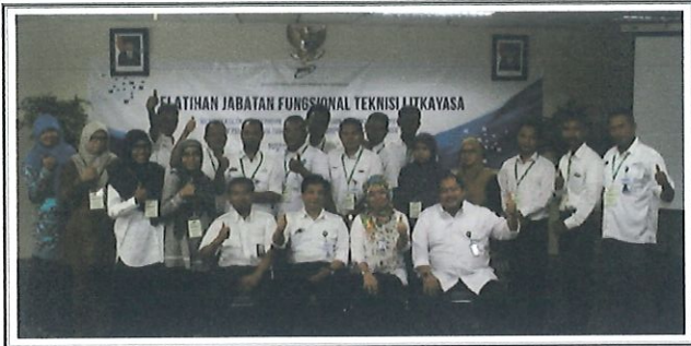
Foto bersama peserta diklat Jabatan Fungsional Teknisi Litkayasa batch.2 dgn Kepala Pusbindiklat BPPT di Ruang Kelas Lt.6 Pusbindiklat Gd.2 BPPT. Jakarta, 17 April 2017.

P usbindiklat BPPT untuk pertama kalinya melaksanakan evaluasi diklat secara online pada Diklat Jabatan Fungsional Teknisi Litkayasa Batch.2. di ruang Pusbindiklat di Lt.6 Gedung BPPT II Jl. M.H. Thamrin No.8. Jakarta Pusat, tanggal 17 s.d 21 April 2017. Diklat JFTL diikuti sebanyak 17 peserta antara lain : 10 org BPPT, 5 org Kemenkes, dan 2 org Kemenperin.