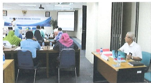
Anggota tim KPMI melaksanakan monitoring Pelaksanaan diklat JFP di ruang kelas Pusbindiklat. Jakarta, 17 Mei 2017

Tim KPMI melaksanakan monitoring untuk meningkatkan mutu penyelenggaraan diklat JFP batch.2. Evaluasi pelaksanaan diklat JFP