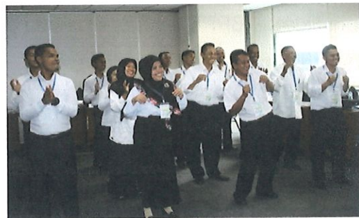
Suasana di kelas materi di namika kelompok. Jakarta, 22 Februari 2017

Penyelenggaraan Diklat selama 4 (empat) hari dengan materi Diklat diberikan selama 32 Jam Pelajaran yang terdiri dari : Pembinaan Karir JFTL, Manajemen Litbangyasa, Butir-butir Kegiatan dan Angka Kredit, Inovasi Teknologi, Teknik Penyusunan Laporan, Tata Cara Pengajuan DUPAK, Dinamika Kelompok dan K3.