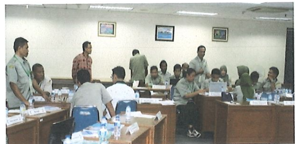
Suasana diskusi kelompok dgn materi teknik Penyusunan Laporan di ruang kelas Pusbindiklat

Penyelenggaraan Diklat selama 4 (empat) hari di mulai pukul 08.00 s.d 16.00. WIB, sebelum diklat dimulai dilaksanakan evaluasi pre test & setelah diklat dilakukan evaluasi post test dilakukan secara manual.