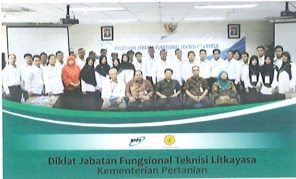
Foto bersama peserta diklat JFTL batch.6 dengan Kepala Pusbindiklat BPPT di Ruang Kelas Lt.6 Pusbindiklat Gd.2 BPPT. Jakarta, 26 September 2017.

P usbindiklat BPPT melaksanakan Diklat Jabatan Fungsional Teknisi Litkayasa Batch.6. di ruang Pusbindiklat di Lt.6 Gedung BPPT II Jl. M.H. Thamrin No.8. Jakarta Pusat, tanggal 05 s.d 18 Desember 2017. Diklat JFTL diikuti sebanyak 30 peserta dari Kementerian Pertanian.