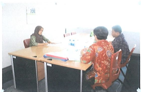
Wawancara dgn calon penerima beasiswa S2 oleh Ka.Pusbindiklat (kiri) & didampingi Ka.Bidang PD (kanan). Jakarta, 17 Januari 2017

D alam rangka pelaksanaan seleksi pegawai calon penerima beasiswa S2 BPPT Tahun 2017 serta untuk meningkatkan SDM Pegawai BPPT. Telah dilaksanakan wawancara seleksi Beasiswa BPPT. Pada hari Selasa, 17 Januari 2017 dan bertempat diruang diklat Pusbindiklat Lt.6,Gd.II BPPT.