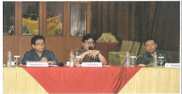
Sambutan Ka.BPPT sekaligus membuka raker Pusbindiklat (tengah) di dampingi Kepala Pusbindiklat (kanan) & Perwakilan Pusyantek (kiri) Bogor, 31 Maret 2017

Dalam raker diikuti tamu undangan dari Perwakilan dari SDMO, Kepala Ro-renkeu, dan Kepala Pusyantek.