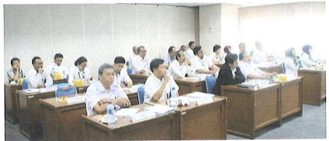
Suasana dalam kelas peserta MOT dalam mendengarkan materi yang dibawakan oleh widyasarwa LAN.

Untuk menghasilkan Diklat Management Of Training (MOT) yang berkualitas, diperlukan suatu pengelolaan yang baik dan benar sehingga tujuan dan sasaran dapat tercapai. Adapun Tujuan : Peserta Diklat dapat mengelola sumber daya Diklat serta menyelenggarakan Diklat dengan lebih baik dan lebih memaknai tugas dan fungsinya.