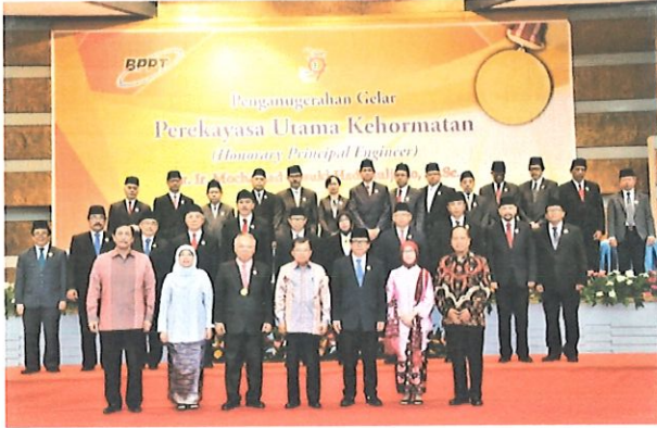
Foto bersama Wakil Presiden RI dgn Para Menteri Serta Majelis Perekayasa. Jakarta, 03 Agustus 2017