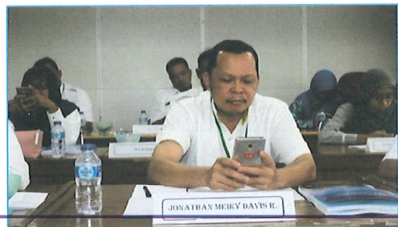
Peserta melakukan evaluasi pre test secara online menggunakan HP

Penyelenggaraan Diklat selama 4 (empat) hari di mulai pukul 08.00 s.d 16.00. WIB, sebelum diklat dimulai dilaksanakan evaluasi pre test & setelah diklat dilakukan evaluasi post test dilakukan secara online.