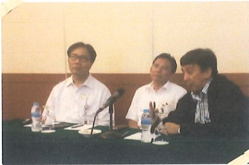
Pembukaan acara oleh Ka. Pusbindiklat di dampingi Aba Subagja - Sekretaris Deputy Bidang SDM Aparatur Kemenpan & RB. di Hotel Grand Sahid, Jakarta, 08 Maret 2017

D alam rangka Mendukung Program Inpassing Nasional sesuai Permenpan & RB No.26 Tahun 2016, BPPT sebagai instansi pembina Jabatan Fungsional Perekayasa (JFP), sedang menyusun Pedoman Pelaksanaan Inpassing Nasional.