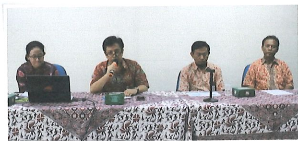
Pembukaan karyasiswa beasiswa oleh Ka. Pusbindiklat di dampingi Ka. Sub bidang diklat teknis (kanan), Ka.bidang AP serta Ka. Sub bidang TU (kiri)

PTN yang menjadi favorit para karyasiswa beasiswa BPPT yaitu : UI (16 orang), UGM (3 orang) dan IPB (1 orang).