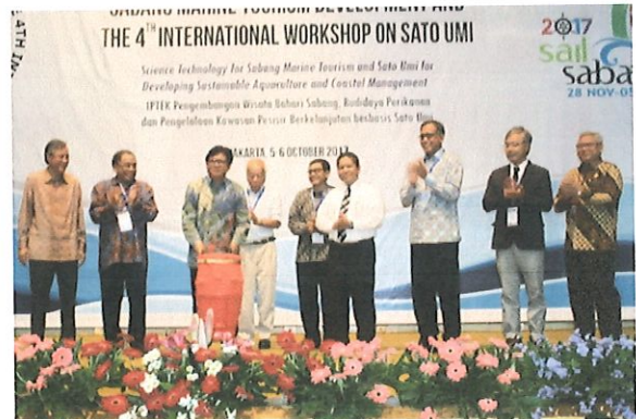
Pembukaan acara seminar Sail Sabang & workshop Sato umi di auditorium BPPT yg disaksikan tamu Undangan dari K/L

Tujuan dari seminar dan workshop ini adalah untuk mensosialisasikan program Sail Sabang dan Pengembangan Wisata Bahari Indonesia, serta mendiseminasikan konsep Sato Umi untuk mendukung program pengembangan budidaya perikanan dan pengelolaan sumberdaya perikanan dan kelautan di kawasan pesisir secara berkelanjutan di Indonesia.