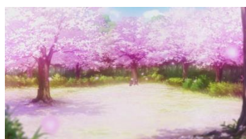
Eps 1 :18.02 hanami