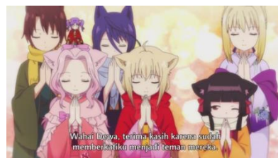
Eps 12, 04.39 (Berdoa di Kuil)

蓮 : この1年を無事に過ごすことができた感謝を伝えに来たのたまに神社に来て身勝手なお願ひするのなんて人間くらいよ。