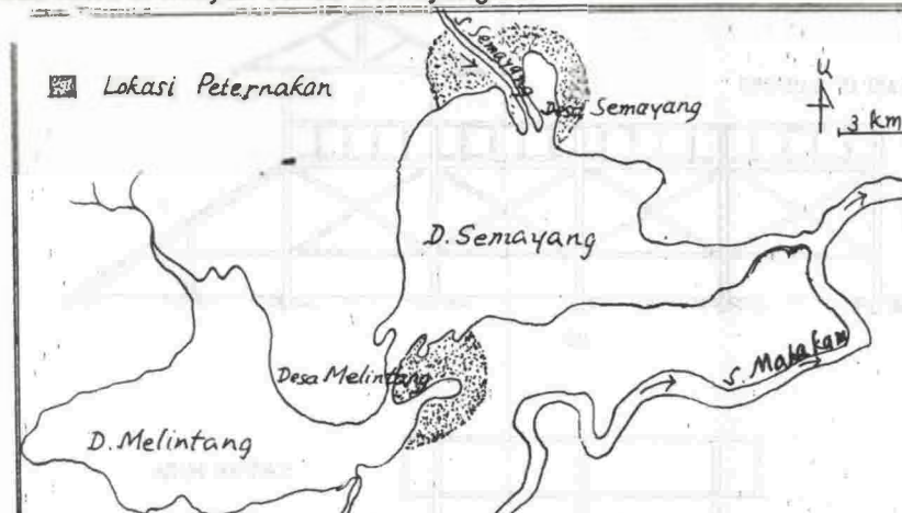
Gambar 1. Lokasi Peternakan Kerbau Rawa di Wilayah Danau Semayang

Dari survai penelitian yang telah dilakukan, diketahui adanya dua kelompok peternakan kerbau rawa di lingkungan perairan danau Semayang, yaitu di desa Semayang dan desa Melintang. Populasi kerbau rawa di desa Semayang sebanyak 275 ekor dan di desa Melintang 400 ekor. Observasi lapangan dan wawancara dengan anggota kelompok peternak telah dilakukan di desa Melintang, sedangkan di desa Semayang hanya dengan ketua kelompok kalang. Dari gambar 1 dapat dilihat sebaran lokasi peternakan kerbau rawa di wilayah danau Semayang ini.