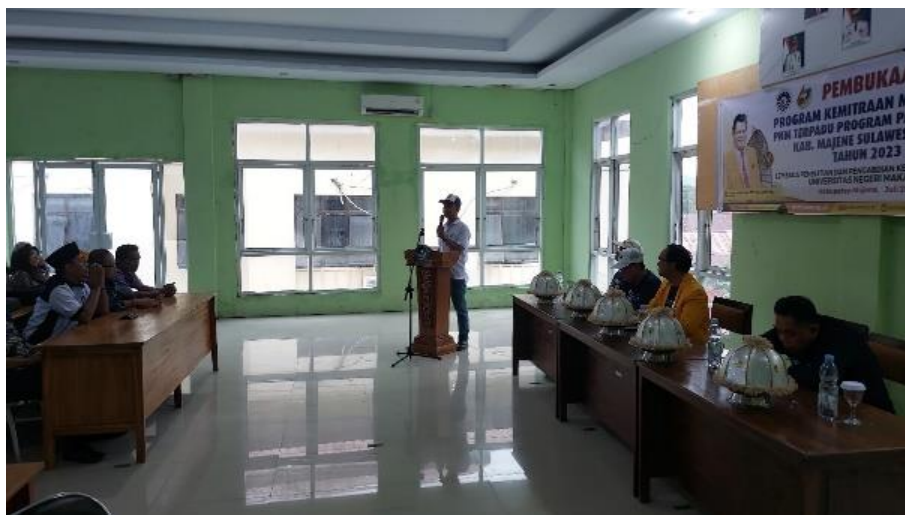
Gambar 1. Sambutan PLT Dinas Pendidikan dan Pemuda Olahraga Kabupaten Majene

Pembukaan. Acara pembukaan kegiatan pengabdian dibuka oleh PLT Kepala Dinas Pendidikan dan Pemuda Olahraga Kabupaten Majene. PLT Kepala Dinas Pendidikan dan Pemuda Olahraga memaparkan harapan dari pihak mitra terhadap pelaksanaan PKM yang dilakukan oleh tim PKM Universitas Negeri Makassar.