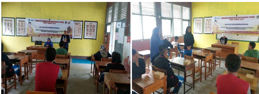
Gambar 2. Penyajian Materi Bermain Drama oleh Tim PKM dan Praktisi

Praktik Bermain Drama. Pada kegiatan praktik bermain drama, peserta melakukan proses pementasan drama dengan naskah singkat.