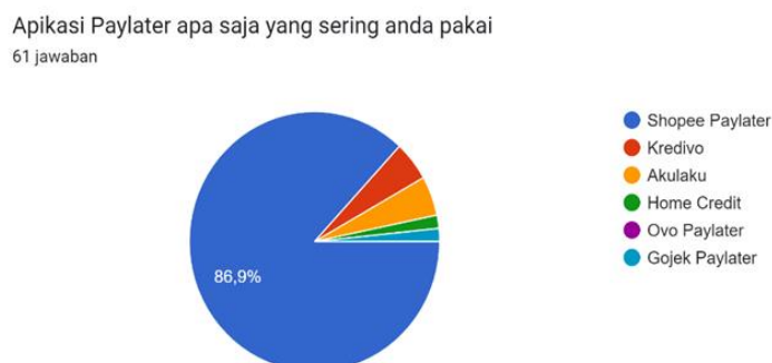
Gambar 6. Aplikasi Paylater yang sering Digunakan

Berdasarkan hasil kuesioner yang diisi oleh generasi Z, terlihat bahwa aplikasi Paylater yang umum digunakan adalah sebagai berikut: