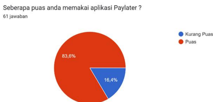
Gambar 3. Kepuasan dalam Pemakaian Paylater

Berikut ini merupakan diagram yang menunjukkan kepuasan dalam pemakaian Paylater responden, dapat dilihat pada diagram berikut: