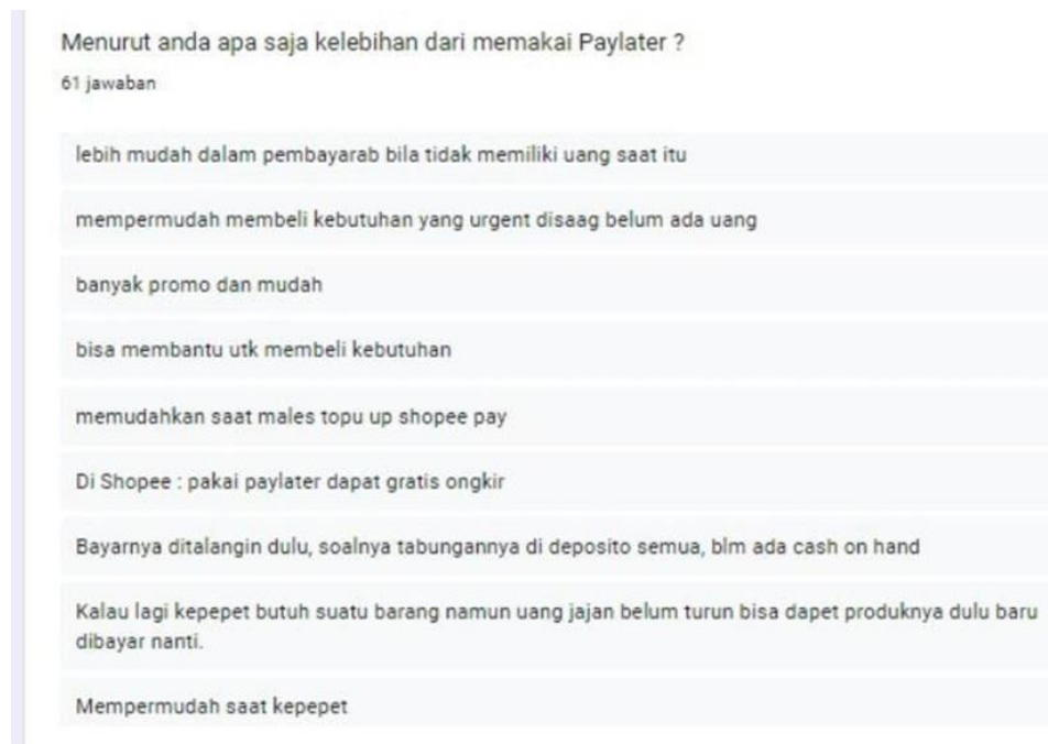
Gambar 4. Kelebihan paylater dari Hasil Pengisian Kuesioner

Berikut adalah ringkasan mengenai kelebihan dan kekurangan Paylater berdasarkan hasil kuesioner yang diisi oleh responden: