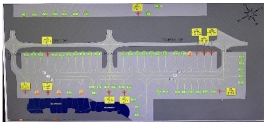
Gambar 3. Parking Stand

Jumlah parking stand untuk saat ini adalah 6 dengan nomor parking stand B07, B08, B09, B10, B11, B12. Terdapat 6 fasilitas garbarata yang beroperasi, maka dengan jumlah 6 garbarata jika personil operasi garbarata hanya 2-3 orang kurang efisien.