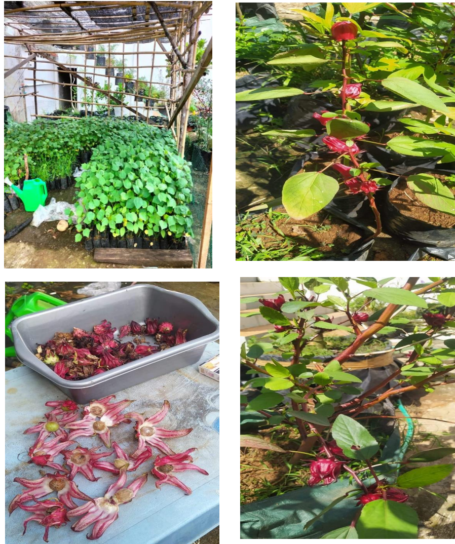
Gambar 2. Bibit dan Bunga Rosella

dilaksanakan pada bulan juli dengan melibatkan 50 orang kader posyandu pada salah satu lahan di kelurahan Anggut Atas. Kemudian Tim memberikan bibit rosella untuk dibudidayakan sebagai upaya menurunkan angka Penyakit Tidak Menular (PTM) khususnya penyakit hipertensi.