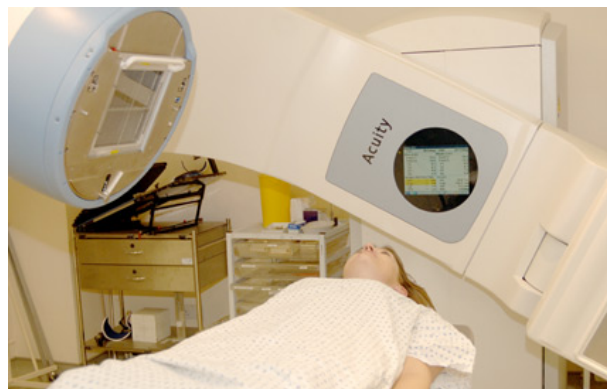
Gambar 3. Pemanfaatan teknologi nuklir dalam bidang kesehatan seperti untuk intensity-modulated radiation therapy (IMRT) .