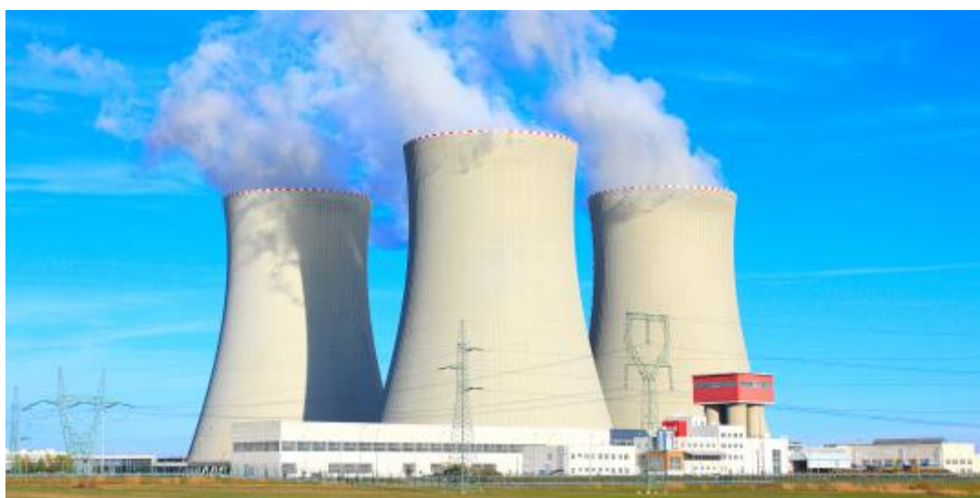
Gambar 5. Pemanfaatan teknologi nuklir untuk pembangkit energi/tenaga (PLTN).

PLTN berdasarkan pada proses fisi nuklir yang merupakan proses pembelahan inti menjadi bagian-bagian yang hampir setara, dan melepaskan energi dan neutron dalam prosesnya. Jika neutron ini ditangkap oleh inti lainnya yang tidak stabil maka inti tersebut akan membelah juga, memicu reaksi berantai. Jika jumlah rata-rata neutron yang dilepaskan per inti atom yang melakukan fisi ke inti atom lain disimbolkan