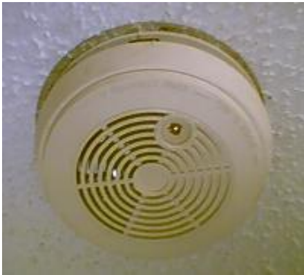
Gambar 1. Sebuah contoh detektor asap menggunakan teknologi nuklir.

menggunakan radiasi dari sejumlah kecil bahan radioaktif untuk mendeteksi keberadaan sumber asap atau panas melalui proses ionisasi. Alat ini berisikan isotop amerisium yang merupakan logam keperakan dan larut dalam asam. Isotop amerisium yang paling stabil (Am-243) memiliki umur paro lebih dari 7500 tahun. Isotop lain seperti tritium digunakan bersama fosfor pada rifle untuk meningkatkan akurasi penembakan pada malam hari dan perpendaran tanda “exit” pada suatu tempat parkir.