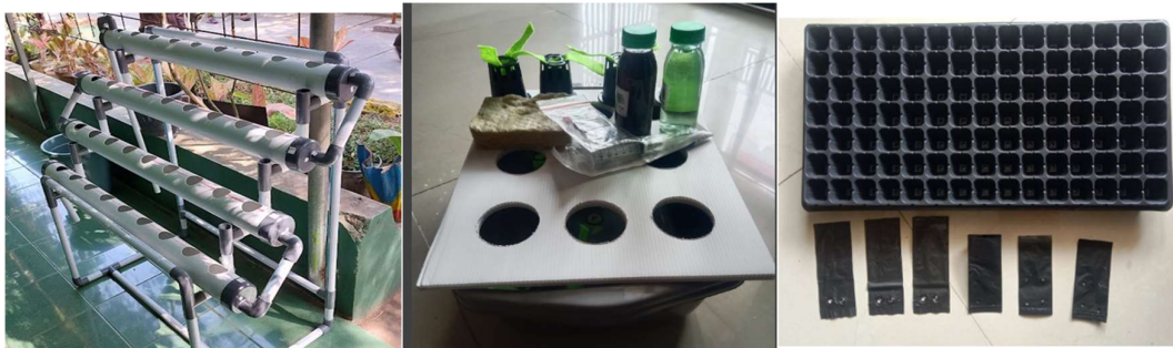
Gambar 1. Alat dan Bahan untuk Proyek

dan media tanam dari campuran arang sekam, tanah, dan kompos. Gambar 1 berikut adalah alat dan bahan yang digunakan selama pelatihan berlangsung dalam perancangan proyek.