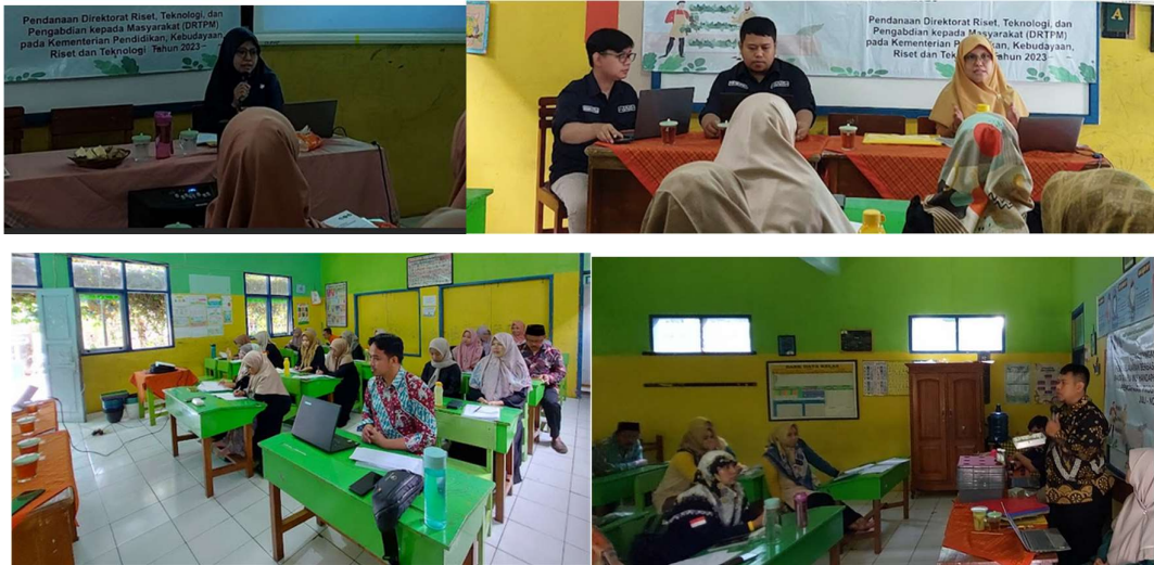
Gambar 3. Penyampaian Materi Pelatihan

capaian pembelajaran dengan proyek menanam sayuran untuk mendukung PRLH. Pada tahap kegiatan ini, metode yang digunakan adalah ceramah, diskusi dan demonstrasi. Gambar 3 berikut ini merupakan kegiatan pelatihan.