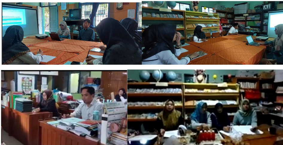
Gambar 4. FGD Fase A, B, C

Implementasi atas pengetahuan dan wawasan perancangan modul ajar kemudian dilanjutkan pada fase kedua pelatihan yaitu dengan mengidentifikasi capaian mata pelajaran yang memungkinkan untuk dilakukan pembelajaran berbasis proyek dan STEAM-H pada mata pelajaran matematika dan IPAS. Selain itu, dilakukan juga identifikasi alat dan bahan yang diperlukan untuk merancang proyek. Pada tahap identifikasi ini, peserta dibagi ke dalam tiga grup sesuai dengan fase capaian pembelajaran pada kurikulum Merdeka yaitu fase A, B, dan C. Metode yang digunakan pada fase pelatihan ini adalah diskusi grup. Gambar 5 berikut menunjukkan aktifitas diskusi setiap grup.