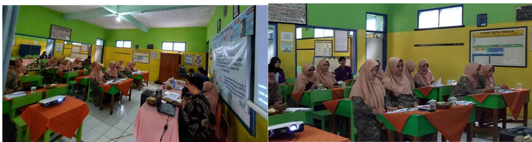
Gambar 2. Pembukaan Pelatihan dan Pretes

Peserta pelatihan pengembangan modul ajar dengan pembelajaran berbasis proyek dan STEAM-H diawali dengan kegiatan pembukaan dan dilanjutkan dengan pretest . Rata-rata hasil pretest adalah 49 dari skor total 100. Adapun persentase peserta menjawab benar dari empat aspek soal tentang regulasi perencanaan pembelajaran, komponen modul ajar, pembelajaran berbasis proyek, dan pendekatan STEAM-H berturut-turut adalah 58%, 54%, 40%, dan 55%. Proses pengerjaan pretest dan kegiatan pembukaan dapat dilihat pada Gambar 2.