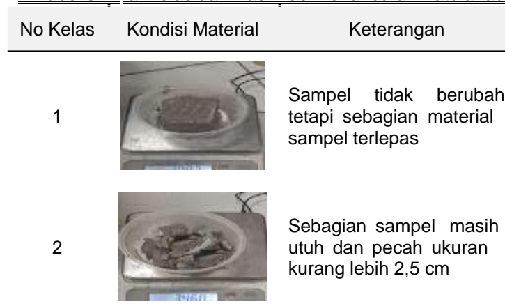
Tabel 3. Nilai Kelas dan klasifikasi Kehancuran Batulanau

pada Tabel 3. Berdasarkan nilai kelas dan klasifikasi slaking indeks, nilai slaking indeks diartikan sebagai tingkat kehancuran batuan, yang berarti semakin tinggi persentase nilai indeks slaking (Is) semakin tinggi pula tingkat kehancurannya seperti yang diperlihatkan pada Tabel 3.