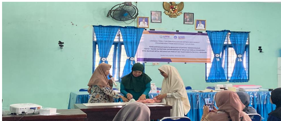
Gambar 3. Proses pendampingan penilaian status gizi pada kader

Kegiatan pendampingan berupa penyampaian teori dan praktek berlangsung sekitar 90 menit. Materi yang disampaikan meliputi penyegaran mengenai tugas dan peran kader posyandu, cara melakukan penilaian status gizi bayi dan balita secara antropometri beserta cara interpretasi dan pelaporannya.