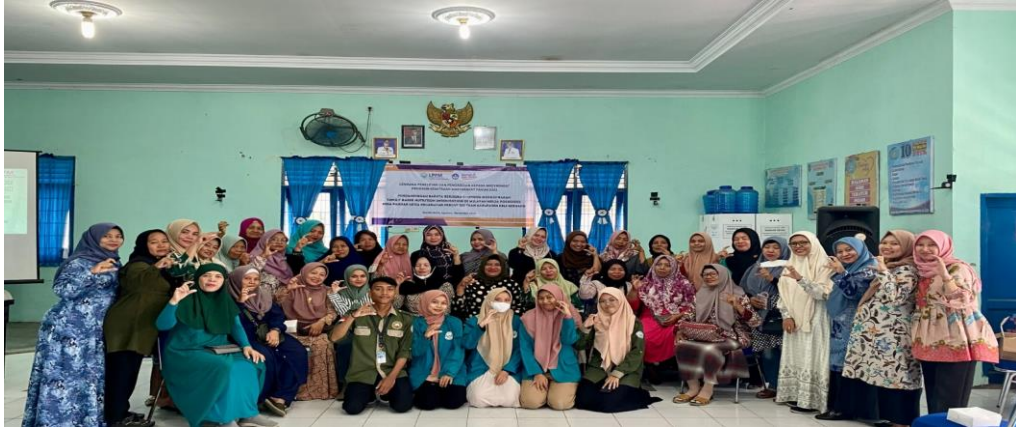
Gambar 4. Foto bersama tim pengabdian, mahasiswa dan kader posyandu

Pengetahuan kader posyandu sebelum dan setelah pendampingan disajikan pada Tabel 1. Skor pengetahuan kader tentang cara penilaian status gizi balita secara signifikan meningkat sebesar 31.05 poin. Proporsi kader yang memiliki pengetahuan kurang berkurang, sedangkan proporsi kader yang memiliki pengetahuan sedang dan baik mengalami peningkatan setelah mengikuti kegiatan pendampingan.