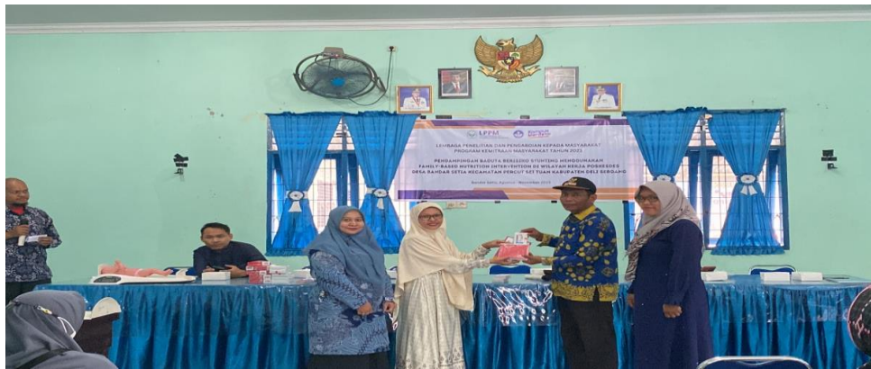
Gambar 2. Serah terima alat pengukur panjang badan

Kegiatan dilaksanakan di Aula Kantor Desa Bandar Setia yang diikuti oleh 31 orang kader posyandu. Usia kader berkisar antara 30-61 tahun. Kegiatan diawali dengan pembukaan oleh kepala desa sekaligus simbolis serah terima alat pengukur tinggi badan oleh tim pengabdian kepada pihak desa (Gambar 2).