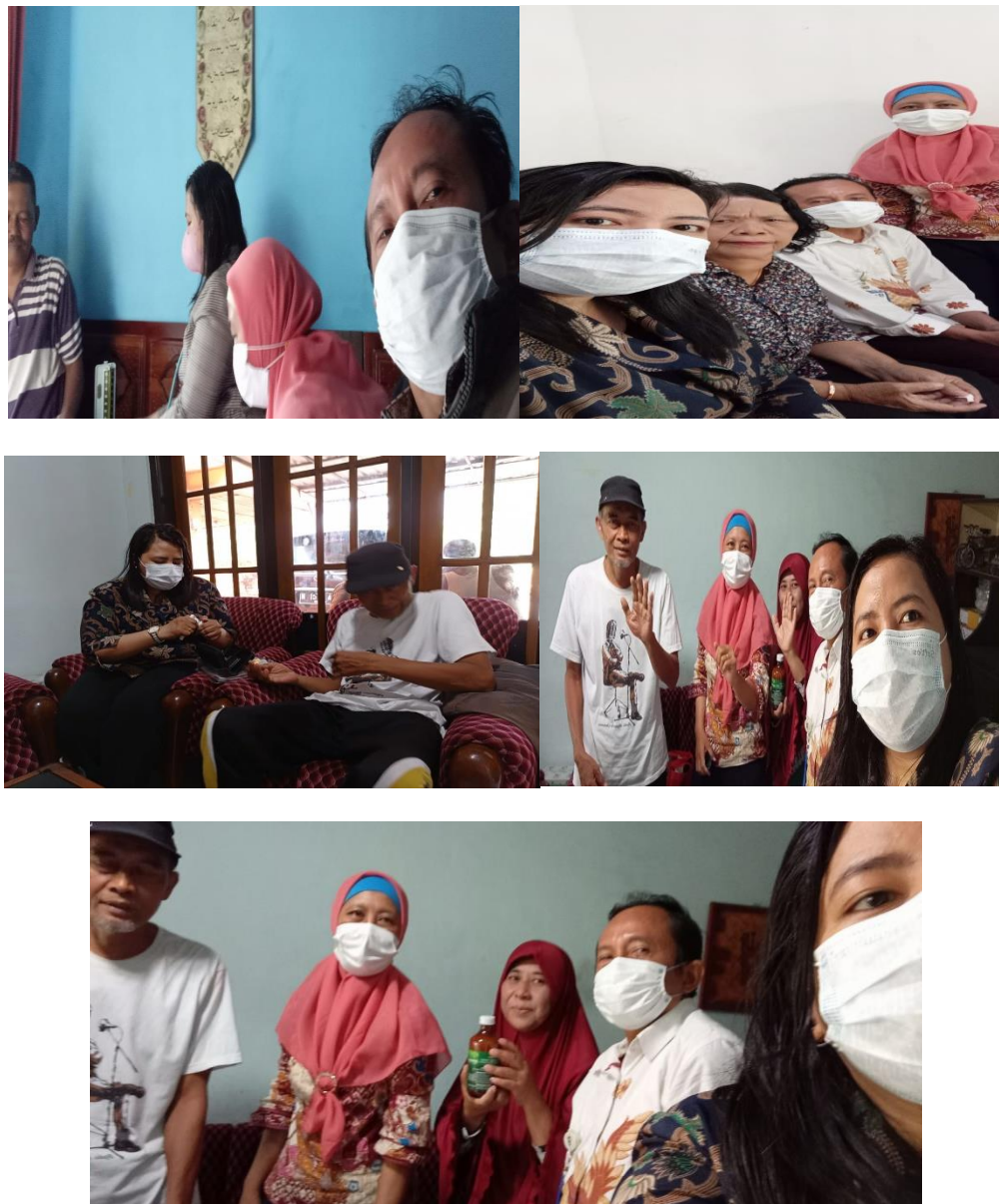
Gambar 2. Kegiatan PkM home care ke lansia di Malang

Kegiatan pengabdian kepada masyarakat dengan dengan Judul Pemberdayaan Lansia Penderita Gout Melalui Edukasi Pengetahuan Secara Home Care di Malang Raya dapat berjalan dengan baik dan lancar sesuai dengan yang telah direncanakan oleh tim pengabdian masyarakat STIKes Panti Waluya Malang. Keberhasilan program kegiatan pengabdian masyarakat ini terjadi atas kerjasama antara tim pengabdian masyarakat STIKes beserta para responden (lansia penderita asam urat). Dalam kegiatan pengabdian masyarakat ini dapat berjalan dengan lancar dan baik disebabkan adanya peran aktif peserta responden (lansia penderita asam urat) hal ini dapat terlihat dari antusiasme para responden (lansia penderita asam urat) tersebut dalam mengikuti kegiatan