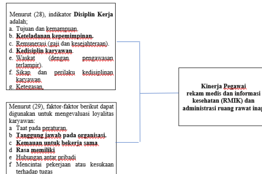
Gambar 2.1 Kerangka Pemikiran Hubungan Disiplin Kerja dan Loyalitas Kerja Terhadap Kinerja Pegawai Rekam medis dan informasi kesehatan (RMIK) dan Administrasi Ruang Rawat Inap.

Kerangka pemikiran dalam penelitian ini adalah: