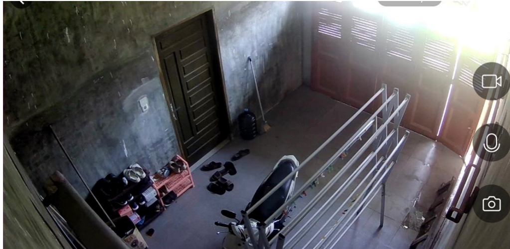
Gambar 4. Tampilan CCTV 3

Pada gambar 4 tampak hasil tampilan dari CCTV 3 yang berlokasi di garasi. Lokasi CCTV ini juga tidak jauh dari letak access point, hanya berjarak sekitar 4 meter, sehingga untuk akses internet tidak terlalu bermasalah walaupun letaknya di indoor