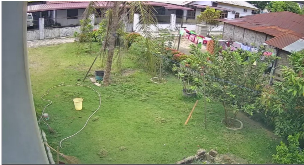
Gambar 2. Tampilan CCTV 1

menggunakan kabel serat yang tebal. Pemilihan kabel listrik ini juga berpengaruh pada daya tahan kabel itu sendiri dan keamanan. Jika serat kabel listrik yang digunakan sangat tipis, dikhawatirkan bisa putus karena terlalu panas dan bisa memicu kebakaran. Berdasarkan hasil uji coba yang dilakukan, semua CCTV berfungsi dengan baik, dan koneksi internet juga stabil.