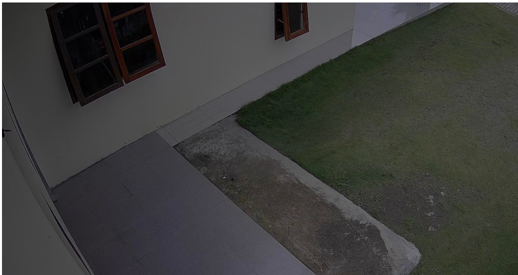
Gambar 3. Tampilan CCTV 2

Pada gambar 2 terlihat hasil dari pantauan CCTV 1 yang berada disamping rumah. CCTV ini merupakan CCTV yang jaraknya dekat dengan access point sehingga tidak terkendala dengan sinyal.