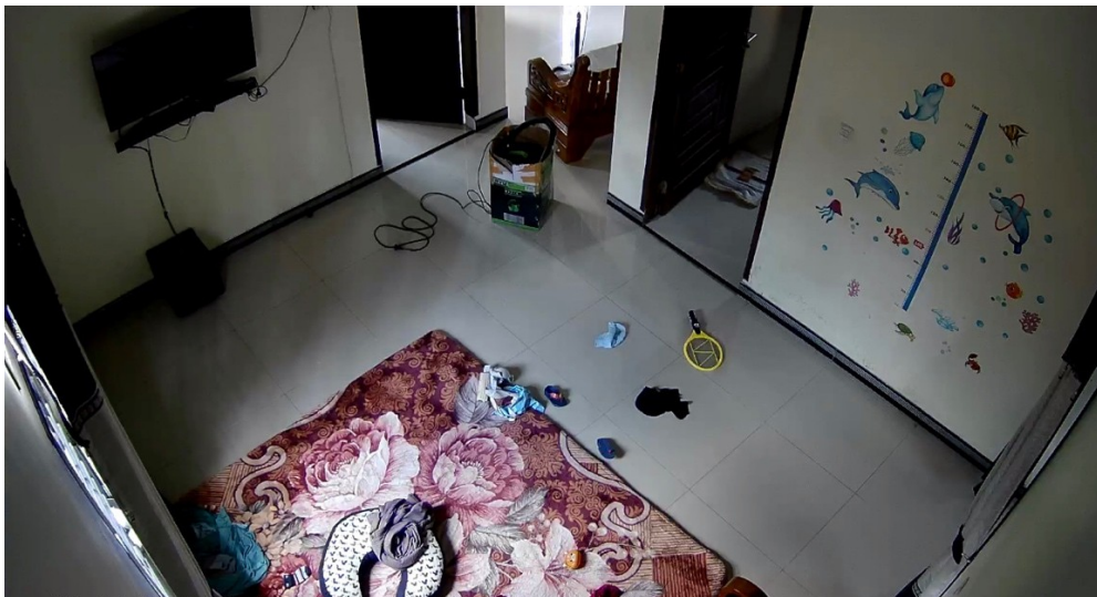
Gambar 5. Tampilan CCTV 4

Pada gambar 4 tampak hasil tampilan dari CCTV 3 yang berlokasi di garasi. Lokasi CCTV ini juga tidak jauh dari letak access point, hanya berjarak sekitar 4 meter, sehingga untuk akses internet tidak terlalu bermasalah walaupun letaknya di indoor