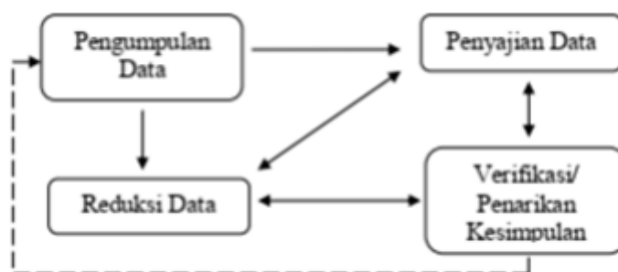
Gambar 2. Model Analisis Interaktif Miles and Huberman

Penelitian ini merupakan jenis penelitian kualitatif dengan pendekatan teori Miles and Huberman. Tahapan dalam analisis tersebut dapat dilihat seperti gambar di bawah ini: