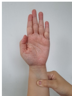
Gambar 1. Akupresur di Lokasi Titik PC6

mengurangi derajat mual dan muntah. Penekanan dapat dilakukan sebanyak 20-30 kali, dengan kekuatan sampai 1/3 kuku berwarna putih (Lu et al., 2021; Viventius et al., 2022).