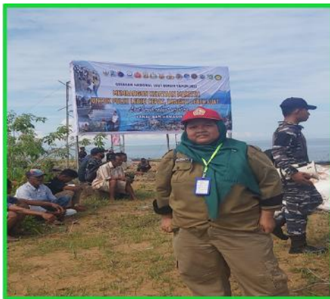
Gambar 4.1 Persiapan Kegiatan

terjaga, berkurangnya sampah walaupun dikawatirkan akan kembali sampah berserakan jika program pengabdian ini selesai, oleh karena itu perlu adanya Rencana Tindak Lanjut, berupa pembuatan plank peringatan dilarang membuang sampah sembarangan dengan berbagai model dan bentuk, penyediaan tong sampah yang berbeda organik dan non organik dan sampah yang bisa didaur ulang, membentuk kelompok dampingan untuk melakukan secara berkala memberi penyadaran kepada masyarakat sekitar terutama yang mengelola pondok di pantai wisata untuk menjaga Kawasan tersebut dari kerusakan akibat sampah. Untuk itu kepedulian civitas akademika terhadap keberlangsungan kelestarian lingkungan perlu tetap dijaga melalui kegiatan yang positif dan berdampak terhadap masyarakat sekitar. Pelaksanaan pengabdian ini juga sebagai upaya memberi penyadaran bagi para pengunjung untuk tidak membuang sampah sembarangan, menjaga kebersihan pantai, menyelamatkan bumi dari pencemaran dan menjaga tetap indah bestari, semoga.