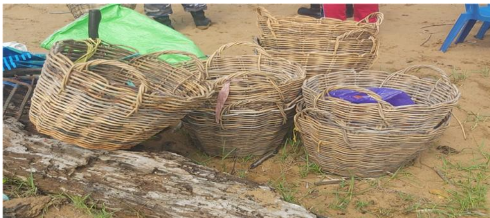
Gambar 4.3 Keranjang Mengangkut Sampah