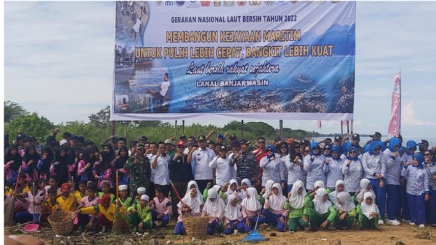
Gambar 4.7 Tim Taruna Peserta Bersih-Bersih Pantai Tabonio