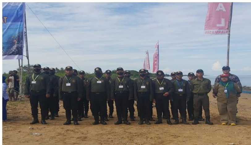
Gambar 4.6 Tim Taruna Amnus