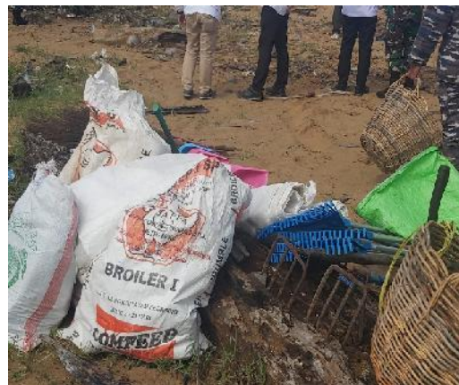
Gambar 4.2 Perlengkapan Alat Saat Bersih-Bersih Pantai