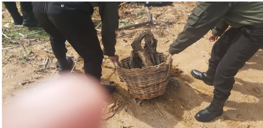
Gambar 4.5 Taruna Amnus Membersihkan Sampah Pantai Tabonio Keranjang Rotan Menggunakan