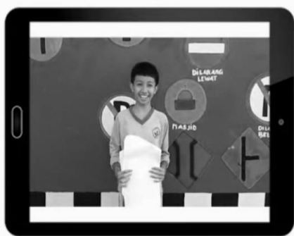
Gambar 3. Hasil QR Code Berbentuk Video

E-book digital berbasis QR code ini juga di publikasi di sekolah. Hasil karya siswa ini dipajang dalam bentuk banner