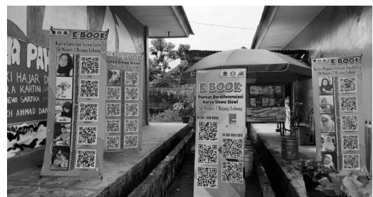
Gambar 4. Hasil QR Code di pojok baca sekolah

Siswa yang pada saat pelajaran tertentu membawa gawai untuk kepentingan pembelajaran, bisa membaca tulisan guru dan teman mereka dengan melakukan scan QR Code yang ada di banner . Siswa juga bisa mengambil foto QR Code tulisan dan bisa membuka tulisan tersebut dimana saja dengan menggunakan gawai mereka masing-masing.