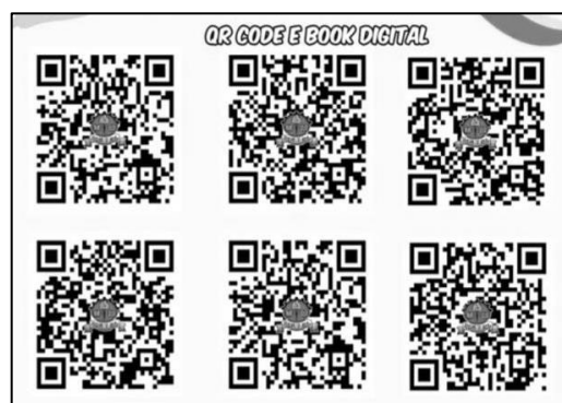
Gambar 1. QR Code Hasil E-Book

File buku yang sudah dibuat oleh siswa dan guru diubah satu persatu menggunakan any flip menjadi buku digital yang bisa dibuka menggunakan gawai ataupun laptop. Link buku yang sudah berbentuk buku digital dari aplikasi any flip tadi di ubah menjadi QR Code .