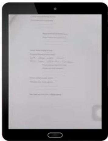
Gambar 2. Hasil QR Code Tulisan Manual

Hasil pantun siswa yang berbentuk video juga diubah ke dalam bentuk QR Code sehingga produk yang dihasilkan ada 3 bentuk yaitu 18 QR Code berbentuk e-book ketikan file, 3 QR Code berbentuk tulisan manual, dan 2 QR Code berbentuk video pantun. QR Code ini bisa dibagikan melalui media sosial sekolah serta bisa diakses oleh pembaca baik siswa, guru, wali siswa maupun masyarakat umum.