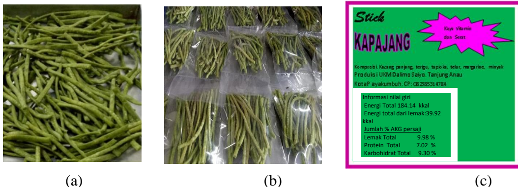
Gambar 4. Stick “kapajang” dan disain label produk

Dengan mengkonsumsi 1 kemasan (100 gr) “stick kapajang” telah terpenuhi AKG karbohidrat 9,30 % dengan energi 130,18 kal. Dapat diartikan kandungan karbohidrat stick kapajang dapat memenuhi kebutuhan harian akan karbohidrat sebanyak 9,30% dari 100 % karbohidrat yang dibutuhkan. Dengan mengkonsumsi 1 kemasan (100 gr) “stick kapajang” akan mendapatkan energi total 184.14 k.kalori dari rata-rata diet 2000 kkal. Untuk menghasilkan produk yang bermutu tidak harus menggunakan teknologi yang tinggi, dengan alat yang sederhana atau manual dan menerapkan Cara Produksi Pangan Olahan yang Baik atau CPPOB.. Menurut Hariyadi dan Hanifah (2020), CPPPOB adalah perwujudan good hygiene practices ditingkat produsen dan merupakan persyaratan umum untuk menjamin produksi yang bermutu dan konsisten. CPPOB. Persyaratan ini meliputi lokasi, bangunan, peralatan, fasilitas sanitasi, bahan, pekerja, pengawasan proses, label dan kemasan, penyimpanan, pengangkutan, pelatihan dokumentasi dan penarikan produk. Gambar produk dan disain label dapat dilihat pada Gambar 4.