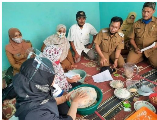
Gambar 1. Kegiatan transfer teknologi

Kegiatan dilakukan dengan praktek langsung berupa transfer hard skill ke kelompok mitra sasaran, kegiatan difokuskan pada olahan kering berbahan baku sayuran yaitu kacang Panjang. Kegiatan dibagi ke dalam 4 kelas, dan mitra dapat langsung melaksanakan praktek dibawah bimbingan Tim Pengabd. Kegiatan juga melibatkan PEMDA dan Dinas Pertanian. Kegiatan transfer teknologi seperti pada Gambar 1 berikut.