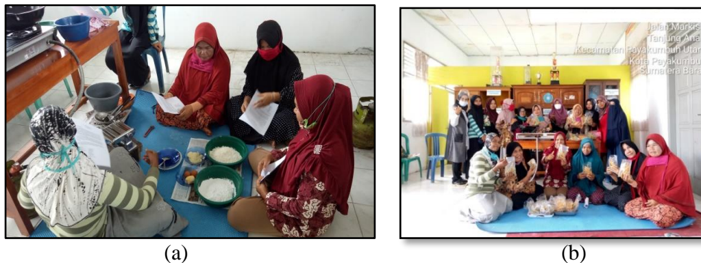
Gambar 2. Kegiatan pembuatan stick (a) Persiapan bahan, (b) Display produk

dan pembentukan), kemudian dilakukan pemasakan. Pemasakan snack dengan penggorengan secara deep fat frying atau bisa juga tanpa menggunakan minyak yaitu di oven. Kegiatan pengolahan aneka stick seperti Gambar 2 berikut.