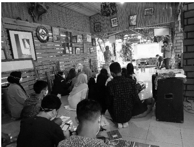
Gambar 5. Narasumber Kegiatan Workshop