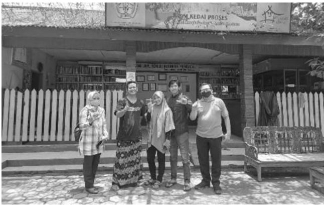
Gambar 1. Wawancara di TBM Kedai Proses

Hasil wawancara diperoleh data jumlah peserta yang mengikuti komunitas kreativitas menulis dan apakah sudah menerapkan penulisan kutipan/sitasi pada hasil karya tulis, hasilnya belum menggunakan kutipan/sitasi.