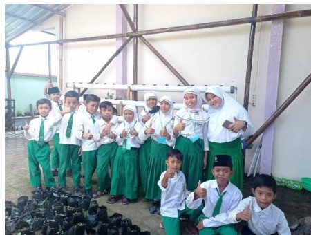
Gambar 4 Kegiatan Pembelajaran di Green House