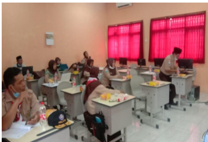
Gambar 3 Kegiatan Pemahaman Strategi Pembelajaran

Kegiatan diatas menunjukkan betapa antusias para guru membuka laptop masing masing untuk mencatat materi yang kita sampaikan guna membantu menentukan beberapa metode dan media serta strategi dalam proses pembelajarn Pendidikan agama Islam dengan menggunakan green house . Disamping itu pula diskusi yang cukup menarik dan serius diantara tim dan para guru. Sesekali terjadi interaksi tanya jawab berkaitan dengan metode pengenalan lingkungan serta kajian agama yang mendasarinya. Hal ini tampak pada dokumentasi gambar dibawah ini.