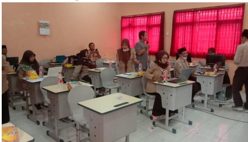
Gambar 2. Kegiatan Pemahaman Strategi Pembelajaran

Pelaksanaan kegiatan ini guru harus mampu mewujudkan pembelajaran kontekstual sebagai konsep belajar yang membantu guru mengaitkan antara materi yang diajarkan dengan situasi dunia nyata dan mendorong siswa membuat hubungan antara pengetahuan yang dimilikinya dengan penerapan dalam kehidupan sehari-hari. Berikut ini dokumentasi kegiatan pelatihan pembelajaran Pendidikan agama Islam pada guru MIN 2 Jember didalam kelas atau ruangan.