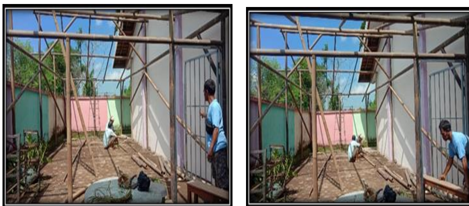
Gambar 2. Dokumentasi Foto Pekerjaan Pembuatan Kerangka Bangunan Green House di MIN 2 Jember

Pekerjaan pembuatan green house pada akhirnya dapat dilanjutkan hari berikutnya, namun kendala cuaca turunnya hujan menjadi faktor penghambat estimasi waktu yang telah ditentukan. Adapun pekerjaan pembuatan green house sudah mencapai tahap 60 persen, seperti tampilan dokumentasi foto berikut ini.