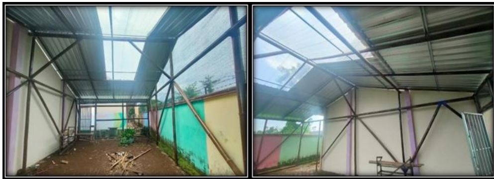
Gambar 3. Bangunan Green House di MIN 2 Jember

Pekerjaan pembuatan kerangka bangunan dan pemasangan atap green house dilaksanakan selama dua hari. Proses finishing kerangka bangunan green house pada sudut-sudut pertemuan tiang ditutup dengan tali sintesis untuk memperbagus tampilan bangunan. Disamping itu proses finishing pada tiang bambu hitam dicat dengan pernis untuk tetap menjaga bentuk tiang sesuai dengan warna dan alur aslinya. Hal ini dilakukan sebagai upaya untuk memperindah tampilan green house sehingga nilai estikanya tampak dengan jelas. Berikut dokumentasi green house yang sudah selesai dikerjakan.