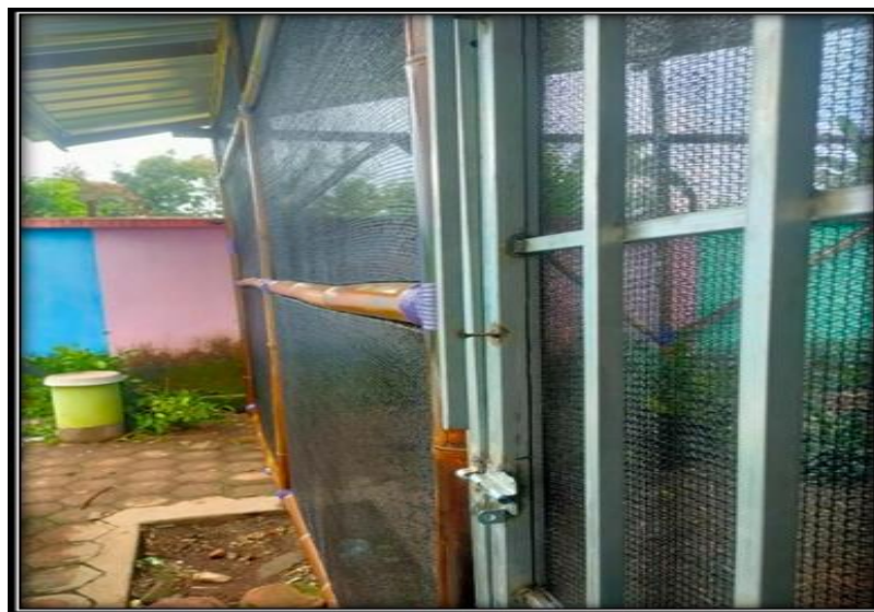
Gambar 3. Bangunan Green House di MIN 2 Jember tampak dari samping

Pemasangan atap yang merupakan perpaduan spadex transparan dan non transparan digunakan dengan pertimbangan bahwa fungsi utama dari keberadaan green house sebagai sarana yang bisa difungsikan untuk kegiatan pembelajaran. Aspek kenyamanan siswa dan guru merupakan pertimbangan utama, sehingga penggunaan dua bahan tersebut disamping mempertimbangkan sinar matahari tetap masuk, disisi lain untuk mengurangi tingkat kepanasan yang bisa menjadi faktor yang dapat mengurangi rasa kenyamanan ketika pembelajaran dilakukan di green house .