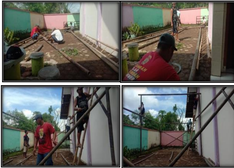
Gambar 2. Kegiatan Pelaksanaan Pembuatan Green House di MIN 2 Jember

dilakukan. Berikut ini dokumentasi kegiatan pelaksanaan pembuatan green house di MIN 2 Jember sebagai mitra kegiatan.