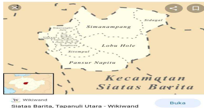
Gambar 1 Lokasi Pengabdian Kepada Masyarakat

Berdasarkan hal tersebut diatas maka yang menjadi rumusan masalah pada kegiatan ini adalah: "Apakah kegiatan pengabdian kepada masyarakat melalui edukasi Edukasi Kesiapsiagaan Ibu Hamil Dalam Mengurangi Risiko Bencana Longsor di Desa Sitompul Kabupaten Tapanuli Utara?."