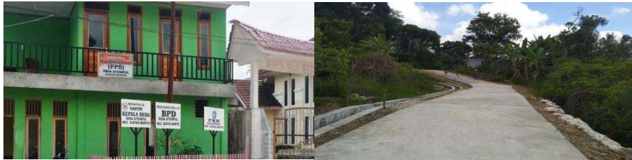
Gambar 2 Lokasi Pengabdian Kepada Masyarakat