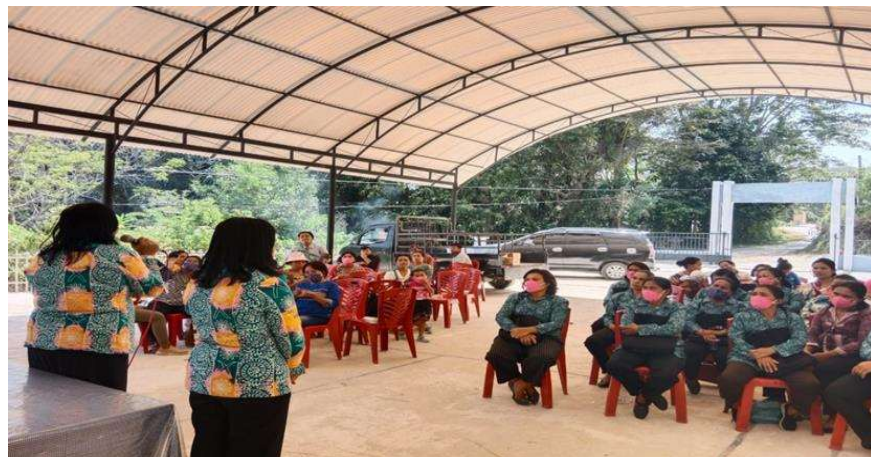
Gambar 3 Dokumentasi