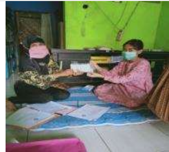
Gambar 3. Penyampaian Materi Senam Nifas