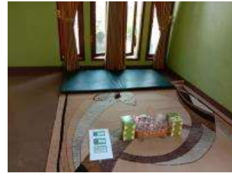
Gambar 2. Persiapan Materi, Bahan dan Alat