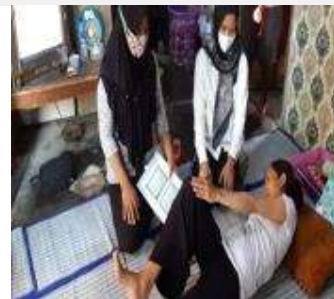
Gambar 4. Kegiatan Sosialisasi dan Bimbingan Senam Nifas