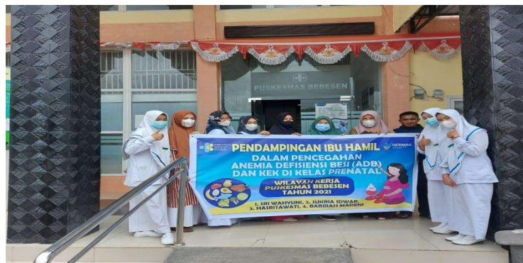
Gambar 2: Foto Kegiatan PKM di Salah Satu Puskesmas Bebesen

Solusi untuk meningkatkan pengetahuan ibu tentang pencegahan Anemia defisiensi besi dan KEK dapat dilakukan dengan berbagai cara yaitu dapat dengan penyuluhan yang dilakukan oleh tenaga kesehatan. Tenaga kesehatan berperan penting dalam pengetahuan ibu, karena tenaga kesehatan merupakan agen pertama dalam memperoleh informasi kesehatan. Cara selanjutnya yaitu dengan memperbaharui informasi-informasi terbaru melalui media massa seperti internet, majalah dan lainnya.