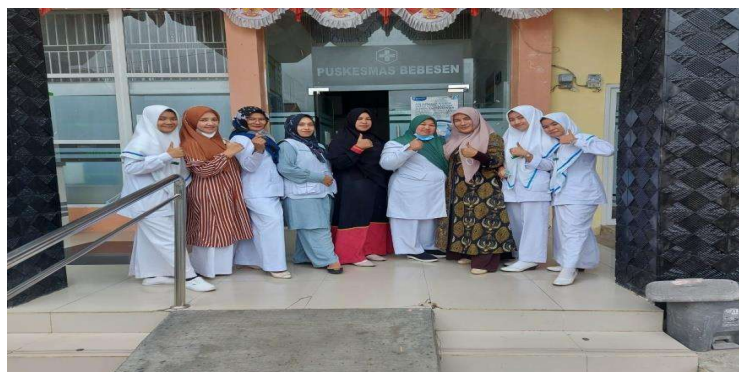
Gambar 3 : Peserta