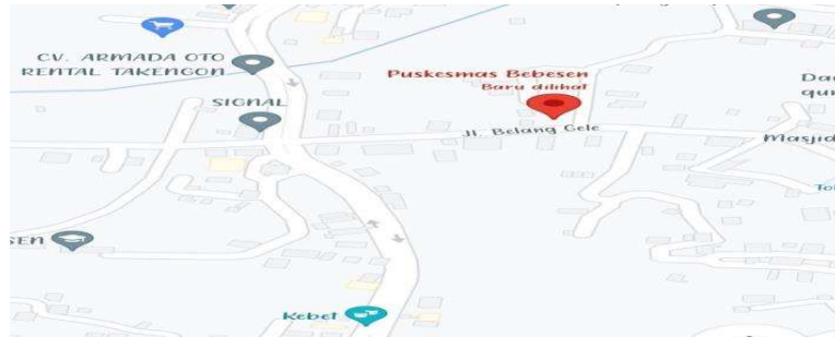
Gambar 1. Peta Wilayah Pusekesmas Bebesen

Berdasarkan uraian latar belakang tersebut di atas maka rumusan masalah dalam pengabmas ini adalah bagaimana Pentingnya pencegahan anemia defisiensi besi dan KEK di kelas prenatal pada ibu hamil di wilayah puskesmas bebesen.