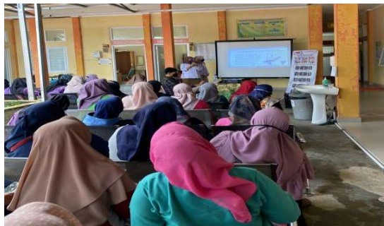
Gambar 4. Penyampaian Materi Penyuluhan