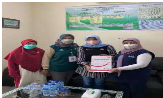
Gambar 6. Pemberian Kenang-kenangan Media Promosi Kesehatan Secara Simbolis kepada Puskesmas Ikur Koto Kota Padang