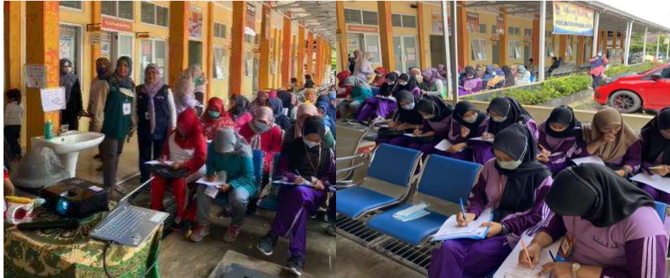
Gambar 3. Peserta Penyuluhan Mengerjakan Pretest dan Postest