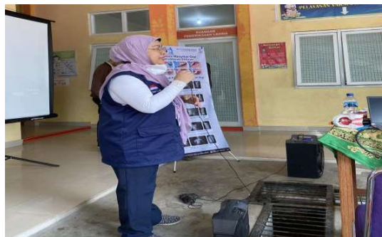
Gambar 5. Focus Groud Discussion (FGD)