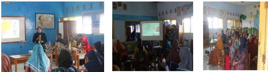
Gambar 2. Gambar kegiatan Pelaksanaan Pendidikan Kesehatan

Pengetahuan merupakan pedoman dalam membentuk tindakan seseorang (Over Behavior), berdasarkan pengamatan diperoleh bahwa perilaku yang didasari pengetahuan. Pencapaian tingkat pengetahuan dipengaruhi beberapa faktor yaitu pendidikan, ekonomi dan informasi. Hasil penelitian yang dilakukan oleh Suryagustina et al mengungkapkan adanya pengaruh Pendidikan Kesehatan terhadap pengetahuan responden tentang pencegahan stunting. Pendidikan Kesehatan mampu meningkatkan tingkat pengetahuan orangtua dalam mencegah stunting, hal ini dikarenakan jika seseorang mendapatkan informasi yang massif yang didapatkan secara terus menerus akan semakin tahu tentang cara pencegahan stunting sehingga akan mengimplementasikan informasi tersebut dalam praktik memberikan asuhan kepada anak untuk mencapai perkembangan dan pertumbuhan yang optimal. Menurut asumsi penulis bahwa informasi dengan metode Pendidikan Kesehatan tentang sesuatu hal yang baru yang diberikan oleh orang yang dianggap cakap dibidangnya cenderung akan mudah diterima masyarakat, sehingga hasil informasi tersebut dapat di aplikasikan dalam kehidupan orang tua dalam memberikan ASI, ASAH, ASUH pada sang buah hati.