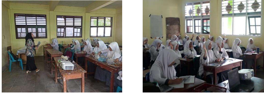
Gambar 2: Kegiatan Pendidikan Kesehatan