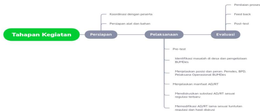
Gambar 1. Metode dan Proses Pelatihan Penyusunan AD/ART BUMDes Ina Huk

Metode yang digunakan dalam pelatihan ini antara lain: diskusi, ceramah, tanya jawab dan membedah dokumen AD/ART lama untuk menemukan gap yang perlu diisi dari ketentuan PP 11 Tahun 2021. Keseluruhan kegiatan ini meliputi tiga bagian dengan beberapa tahapan.