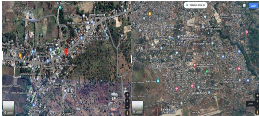
Gambar 3. Lokasi BUMDes Ina Huk dan lokasi kegiatan di LPPM Unwira

Sebelum memulai kegiatan pelatihan, semua peserta diminta untuk mengisi lembar kuesioner berisi pre-test pengetahuan dan pemahaman mereka tentang BUMDes dan AD/ART. Peserta melingkari pilihannya pada setiap pertanyaan sesuai dengan apa yang dia ketahui.