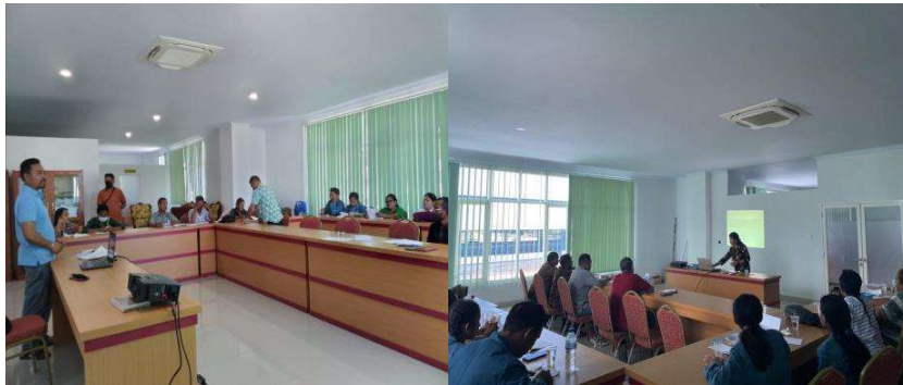
Gambar 5. Pemaparan Materi dan Diskusi Bersama Narasumber

Pada sesi terakhir, peserta diminta untuk melakukan evaluasi terhadap proses dan substansi materi yang diberikan. Peserta mengaku puas karena mendapatkan masukan terkait bagaimana memecahkan kebuntuan komunikasi dan kemandegan pengelolaan BUMDes Ina Huk. Mereka juga diminta untuk mengisi post-test untuk mengukur perubahan yang terjadi.