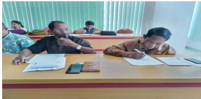
Gambar 4. Pengisian Kuesioner oleh Peserta

Sebelum memulai kegiatan pelatihan, semua peserta diminta untuk mengisi lembar kuesioner berisi pre-test pengetahuan dan pemahaman mereka tentang BUMDes dan AD/ART. Peserta melingkari pilihannya pada setiap pertanyaan sesuai dengan apa yang dia ketahui.