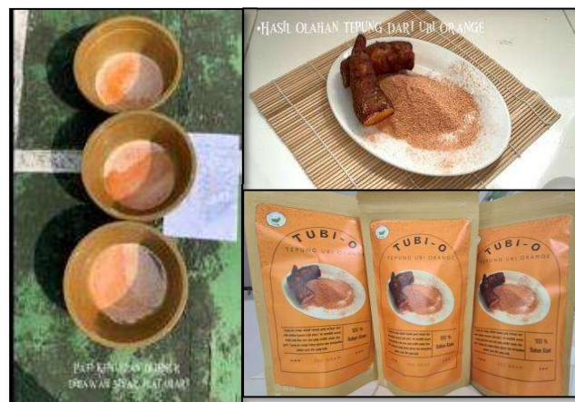
Gambar 5 Hasil Olahan Tepung Ubi Orange

Umbi-umbian pemanfaatannya masih terbatas. Pengolahan bahan-bahan ini menjadi tepung atau pati kemudian diformulasikan dengan komposisi tertentu serta penambahan bahan tambahan berupa hidrokoloid akan dapat menghasilkan roti yang sedikit mengandung gluten tetapi bentuk dan cita rasanya menyerupai roti yang terbuat dari terigu (Prasetyo & Slnaga, 2020). Tahapan pembuatan pati ubi jalar orange yaitu yaitu pertama daging ubi jalar orange dipisahkan dari kulitnya dengan cara pengupasan (Yuliansar, et.al. , 2020). Selama pengupasan sortasi bahan baku dengan pemilihan ubi jalar orange yang bagus. Daging ubi jalar orange di cuci sampai bersih di dalam bak yang berisi air untuk memisahkan kotoran yang menempel pada ubi jalar orange. Daging ubi jalar orange diparut secara manual (parutan biasa) sampai halus menjadi bubur umbi. Umbi yang sudah diparut ditimbang kembali, kemudian ditambahkan air sehingga terbentuk bubur dan diremas-remas agar pati lebih banyak yang terlepas dari sel umbi.