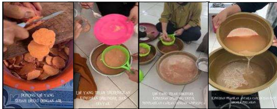
Gambar 4 Pendampingan Pengolahan Tepung Ubi Orange