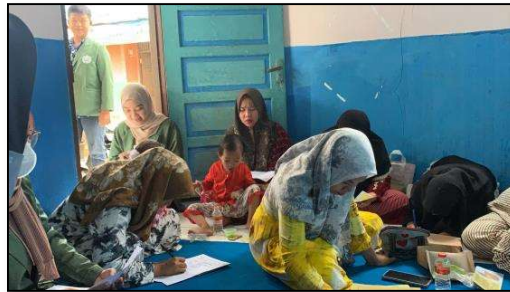
Gambar 2 Pengambilan Data Primer Pretest

Survey pendahuluan meliputi pengambilan data primer menggunakan lembar daftar pertanyaan meliputi karakteristik responden dan pengetahuan serta pemanfaatan ubi jalar orange. Langkah selanjutnya adalah persiapan materi sosialisasi dan alat serta bahan yang digunakan untuk pendampingan pengolahan produk pada minggu ke dua. Kegiatan inti dilaksanakan minggu ke dua meliputi Edukasi oleh tim pengabdian dengan materi kandungan ubi jalar orange, jenis makanan yang bisa di olah dan pemaparan kegiatan pendampingan pengolahan tepung ubi jalar orange. Adapun kegiatan pengambilan data dan edukasi dapat dilihat pada gambar di bawah ini: