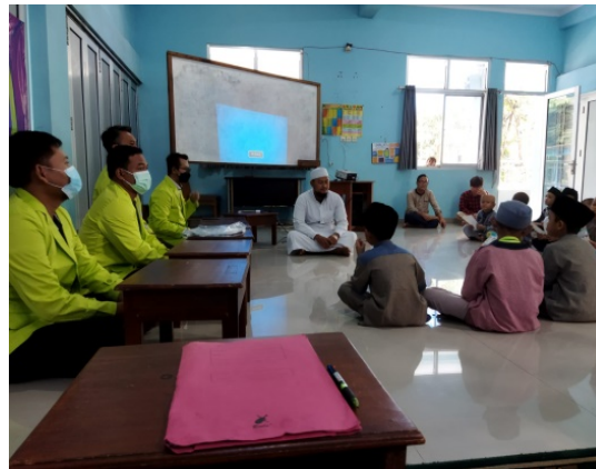
Gambar 1. Pembukaan Kegiatan Pelaksanaan Pengabdian Kepada Masyarakat

Dhuafa Cirebon dan seluruh jajaran pengurus pesantren. Tampak di foto sebagai berikut: