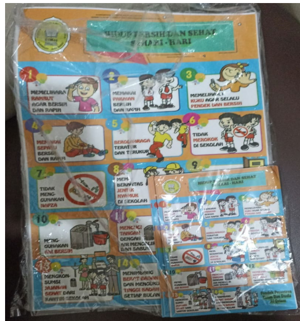
Gambar 2. Materi yang diberikan

orang (73,8%). Hal ini sejalan dengan penelitian yang dilakukan oleh (Sulastri, Purna and Suyasa, 2019) bahwa pada permulaan anak usia 6 tahun anak akan mulai masuk sekolah dan telah memiliki lingkup yang luas sehingga dapat mempengaruhi kebiasaan-kebiasaan orang-orang sekitar. Hal ini akan mempermudah perubahan perilaku dengan semakin banyaknya pengetahuan dari setiap anak sekolah dasar.