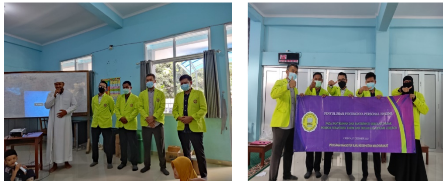
Gambar 6. Dokumentasi penutupan kegiatan

Semua kegiatan berjalan lancar dan baik, seluruh santri dapat berkontribusi dengan baik selama jalannya acara sekaligus pengasuh pesantren yang ikut terlibat selama kegiatan berlangsung.