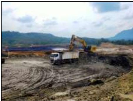
Gambar 4.1 Pola Pemuatan Overburden Fleet EXZ 5005

Pola pemuatan material hasil pengupasan overburden yang dilakukan oleh excavator Caterpillar 345 GC pada fleet EXZ 5005, yaitu menggunakan pola pemuatan top loading dan dengan posisi single back up , yaitu dilakukan dengan posisi alat angkut membelakangi alat muat dan siap diisi, dimana lebar area loading point aktual untuk fleet EXZ 5005 sebesar 14,81 meter.