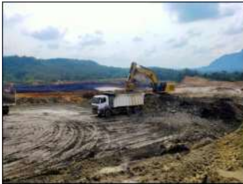
Gambar 4.5 Kondisi Lebar Area Loading Point Fleet EXZ 5005

Pada kondisi di front penambangan overburden PT XYZ terdapat lebar area loading point yang cenderung sempit dengan lebar aktual 14,81 meter pada fleet 5005 Caterpillar 345 GC.