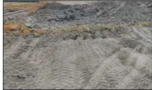
Gambar 4.2 Jenis Material Clay

EXZ 5005 Caterpillar 345 GC, yaitu material jenis clay dengan % swell sebesar 30% (Caterpillar. 2011). Nilai persen pengembangan setiap klasifikasi tanah atau material berbeda sesuai dengan jenis tanahnya dapat dilihat pada tabel 2.1.