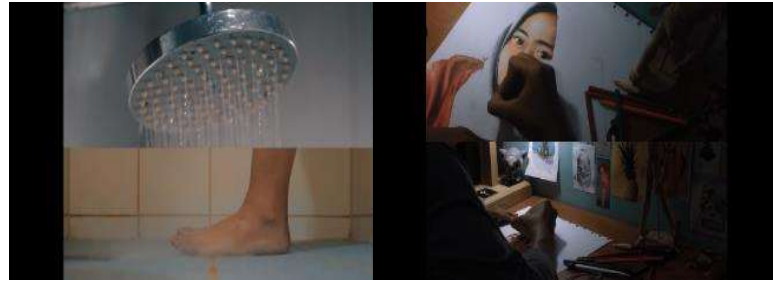
Gambar 1. Contoh gambar alternate syntagma

Alternate syntagma merupakan peristiwa kronologis yang terjadi dalam dua shot secara bergantian dan berhubungan dengan menyatukan potongan gambar yang berbeda namun memiliki satu kesamaan dan disajikan secara bersamaan (Metz, 1991). Ciri khas dari sintagma ini adalah menampilkan beberapa potongan gambar secara bersamaan namun memiliki makna yang sama. Pada menit pertama dalam video klip, terdapat beberapa potongan gambar yang berkejaran.