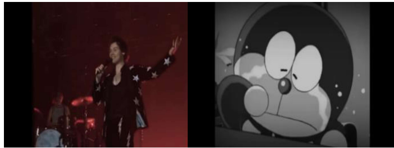
Gambar 5. Contoh gambar autonomous shot

Autonomous shot merupakan single shot yang ditambah dengan empat jenis insert . Menampilkan episode dari plot, dengan empat jenis insert yang dimaksud adalah: nondiegetic insert (gambar yang menghadirkan objek eksterior ke dunia cerita), subjective insert (gambar penyisipan yang mewakili karakter, seperti ingatan, mimpi atau halusinasi), displaced diegetic insert (gambar diegetik untuk sementara dan / atau spasial di luar konteks), dan explanatory insert (gambar yang menjelaskan peristiwa diegetik) (Stam, 1992). Gambar pertama merupakan non diegetic insert yang menampilkan perumpaan dalam bentuk objek lain, sedangkan gambar kedua merupakan subjective insert yang menampilkan representasi perasaan subjek, seperti perasaan sedih, kecewa, ketakutan, dan lain-lain.