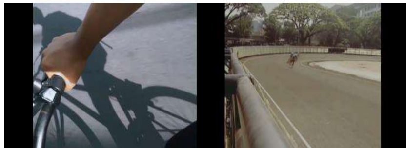
Gambar 2. Contoh gambar episodic sequences

Alternate syntagma merupakan peristiwa kronologis yang terjadi dalam dua shot secara bergantian dan berhubungan dengan menyatukan potongan gambar yang berbeda namun memiliki satu kesamaan dan disajikan secara bersamaan (Metz, 1991). Ciri khas dari sintagma ini adalah menampilkan beberapa potongan gambar secara bersamaan namun memiliki makna yang sama. Pada menit pertama dalam video klip, terdapat beberapa potongan gambar yang berkejaran.