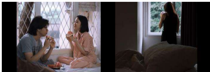
Gambar 6. Contoh gambar parallel syntagma

Autonomous shot merupakan single shot yang ditambah dengan empat jenis insert . Menampilkan episode dari plot, dengan empat jenis insert yang dimaksud adalah: nondiegetic insert (gambar yang menghadirkan objek eksterior ke dunia cerita), subjective insert (gambar penyisipan yang mewakili karakter, seperti ingatan, mimpi atau halusinasi), displaced diegetic insert (gambar diegetik untuk sementara dan / atau spasial di luar konteks), dan explanatory insert (gambar yang menjelaskan peristiwa diegetik) (Stam, 1992). Gambar pertama merupakan non diegetic insert yang menampilkan perumpaan dalam bentuk objek lain, sedangkan gambar kedua merupakan subjective insert yang menampilkan representasi perasaan subjek, seperti perasaan sedih, kecewa, ketakutan, dan lain-lain.