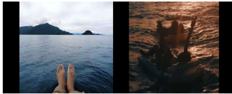
Gambar 3. Contoh gambar ordinary sequences

Ordinary sequences merupakan shot yang lompatannya terkesan tidak teratur, tidak memiliki tema/tujuan yang sama. Tetapi berada pada setting yang sama. Perpindahan/break menandakan kebalikannya, dan tidak terduga (Metz, 1991). Berbeda dengan episodic sequences , ordinary sequences merupakan sequences utuh walau menampilkan shot yang berbeda, namun masih dalam waktu yang sama, dan memiliki maksud yang sama. Biasanya, gambar pertama yang ditampilkan akan muncul lebih lama agar menjadi penjelas untuk gambar selanjutnya. Kedua gambar diatas merupakan gambar berdampingan dan memiliki maksud yang sama.