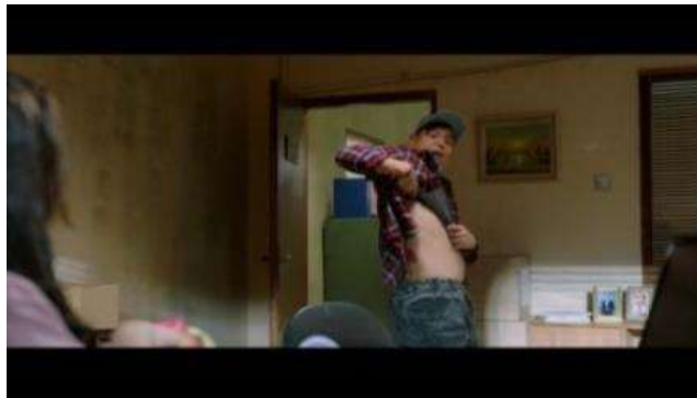
Gambar 9 Adegan Yongki Membuka Bajunya (Dok. Screenshot Sintia Abdillah, 21/April/2023; Sumber Film Milly & Memet (Ini Bukan Cinta & Rangga ; Timecode: 01:13:03)

Adegan humor tercipta menggunakan teknik bahasa dan identitas. Yongki menggunakan topi bertuliskan “Kurang suka dibacok”, hal ini mendukung terciptanya humor melalui bahasa dan identitas. Yongki mengira bahwa alat yang digunakan Milly merupakan alat bekam, kemudian ia bercerita bahwa telah melakukan bekam sambil