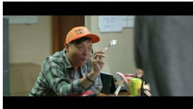
Gambar 2 Gerakan Yongki

Adegan humor terjadi saat Iin menanggapi ucapan Mamet dengan menghina Somad yang hobi menumpuk bon utang dan mereka berdua saling ejek satu sama lain. Peristiwa tersebut terjadi pada timecode 00:18:24 - 00:18:42. Dialog antara Somad dan Iin yang saling ejek, menghina, dan merendahkan menjadi sarana teknik penciptaan humor melalui bahasa. Selain saling ejek humor juga tercipta melalui kesalahan pengucapan kata foto profil menjadi poto profil dan foto porfil.