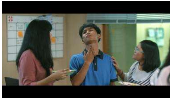
Gambar 4 Adegan Somad tersedak Ampela (Dok. Screenshot Sintia Abdillah, 21/April/2023; Sumber Film Milly & Memet (Ini Bukan Cinta & Rangga) ; Timecode: 00:23:26 & 00:23:41)

Pada adegan ini humor tercipta melalui bahasa dan logika yang menceritakan Somad tersedak ampela dan berusaha mengambil minum, namun usahanya selalu gagal.