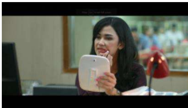
Gambar 1 Riasan Cemong Lela

(Dok. Screenshot Sintia Abdillah, 21/April/2023; Sumber Film Milly & Mamet (Ini Bukan Cinta & Rangga) ; Timecode: 00:11:54)