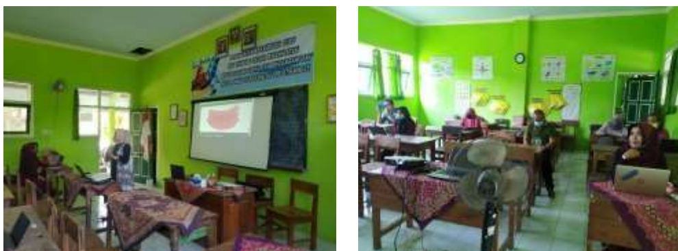
Gambar 2: Proses Penyampaian Materi

Materi kedua dilaksanakan pada tanggal 13 Oktober 2021 oleh Laelatul Arofah, M.Pd dan Rosalia Dewi Nawantara, M.Pd terkait Konsep Dasar Media yang meliputi definisi, jenis media, manfaat, dan tantangan media pembelajaran di pandemi Covid-19. Kemudian materi ketiga pada tanggal 19 Oktober 2021 oleh Restu Dwi Ariyanto, M.Pd memaparkan tentang media audio visual motion graphic dan pengenalan aplikasi Canva meliputi kelebihan Canva dan ragam menu dalam aplikasi Canva.