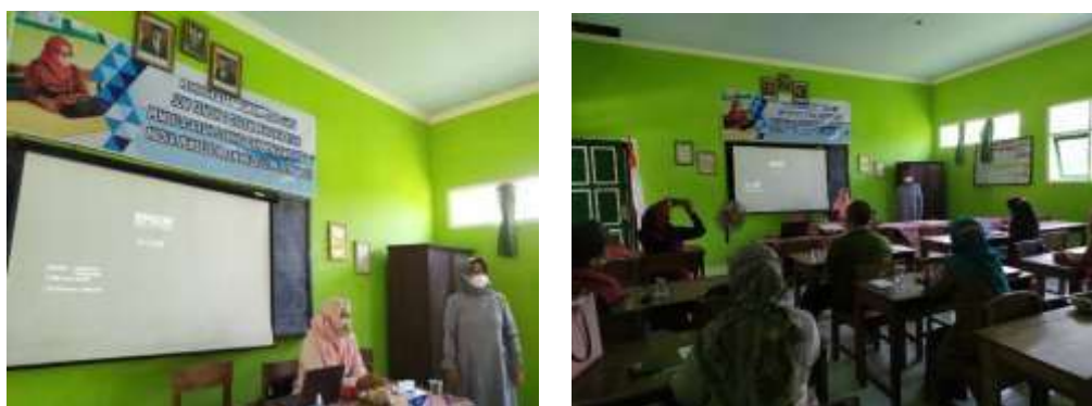
Gambar 4: Proses presentasi media pembelajaran

Kegiatan tanggal 15 November 2021 dilakukan kegiatan presentasi & evaluasi hasil media motion graphic melalui diskusi kelompok kecil. Dalam kegiatan presentasi dibagi menjadi kelompok kecil, masing-masing kelompok akan memaparkan media motion graphic yang telah dibuat.