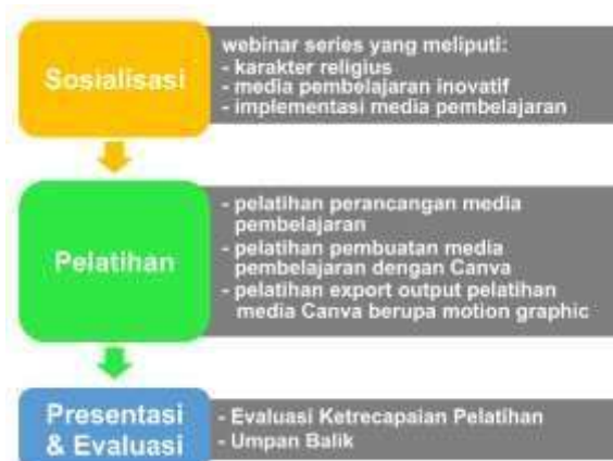
Gambar 1: Alur Pelaksanaan Pengabdian Masyarakat

Kegiatan Pengabdian kepada masyarakat dilaksanakan menjadi 3 tahap yang dimodifikasi sesuai kebutuhan yaitu: (1) sosialisasi; (2) praktik pelatihan; (3) monitoring & evaluasi (Suhandiah, Sudarmaningtyas & Ayuningtyas, 2020). Secara teknis, kegiatan ini terdiri dari tiga tahapan sebagaimana tercantum pada gambar 1 sebagai berikut.