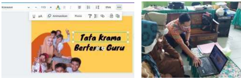
Gambar 3: Contoh materi pelatihan di Canva dan Asistensi pembuatan media

Setelah itu kegiatan Praktik mandiri pembuatan Media pembelajaran dilakukan oleh Restu Dwi Ariyanto, M.Pd dan Vidya Sari Aszahra tanggal 9-12 November 2021. Dalam pembuatan motion graphic mandiri di bagi 2 peserta tiap karya agar karya yang dihasilkan dapat maksimal sesuai aspek audio visual.