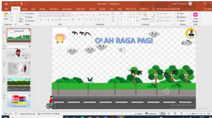
Gambar 1. awal pembuatan video pembelajaran

Tahap presentasi dilakukan untuk memberikan pemahaman awal bagi guru, mulai dari perancangan, penyusunan, mendesain sampai dengan menyajikan materi ke siswa, kemanfaatannya, dan penerapannya dalam pembuatan media pembelajaran interaktif.