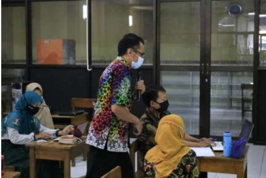
Gambar 3 : Mendampingi guru-guru membuat media pembelajaran

Dari media pembelajaran yang dibuat oleh guru-guru narasumber meminta beberapa guru untuk mempresentasikan hasil yang sudah dibuat, Narasumber mendampingi, memandu dan mengarahkan serta memberikan solusi apabila timbul permasalahan selama penugasan praktik.