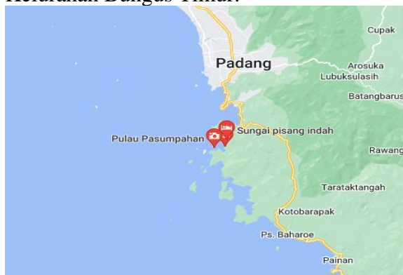
Gambar 1. Peta Lokasi Penelitian Sungai Pisang, Kecamatan Bugus Tl. Kabung

Sungai Pisang terletak di wilayah Kelurahan Teluk Kabung Selatan Kecamatan Bungus Teluk Kabung Kota Padang, Kecamatan ini memiliki 6 kelurahan yakni: 1. Kelurahan Teluk Kabung Selatan, 2. Kelurahan Bungus Selatan, 3. Kelurahan Teluk Kabung Tengah, 4. Kelurahan Teluk Kabung Utara, 5. Kelurahan Bungus Timur.