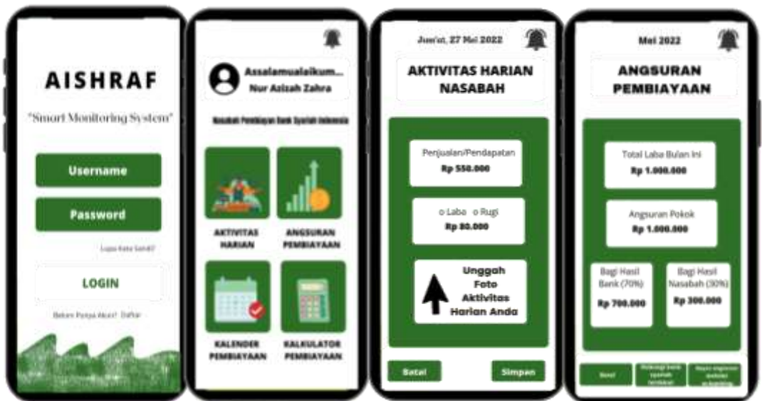
Gambar 1. Tampilan Aplikasi AISHRAF

Adapun desain aplikasi AISHRAF digambarkan pada gambar berikut: